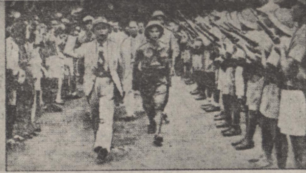
دو عکس بالا از جریان فعالیت واحدهای مختلف پادشاه فرانسه در لائوس و فعالیت شورشیان کمونیست «ویت من» اخیراً در مطبوعات فرانسه چاپ شده است : در عکس دست راست ژنرال جیب فاماده کل ارتش شورشیان هنگام بازدید نیروهای مسلح خویش در یکی از دهکده های شمال شهر «لانها» می در نظر کشور لائوس دیده میشود و در عکس دیگر افران پادگان فرانسه هنگام تعلیم و طرز استفاده از سلاح جدید بر بازار ارتش لائوس می باشد.