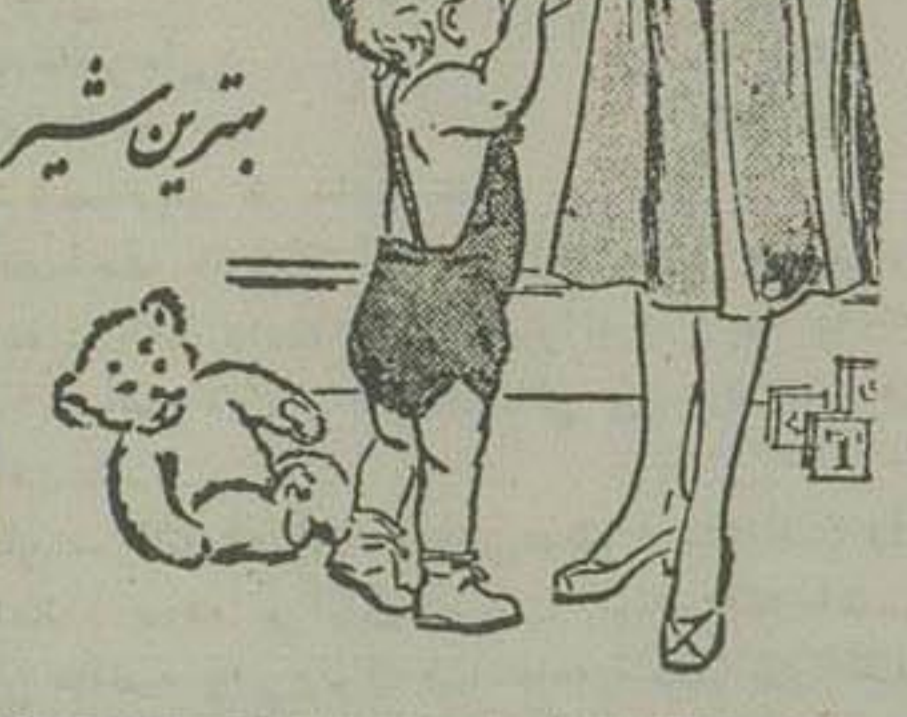
برای بچه های شما