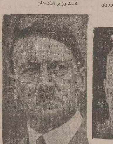
چرچیل نخست وزیر انگلستان