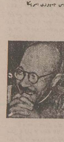
تووی نخست وزیر ژاپن