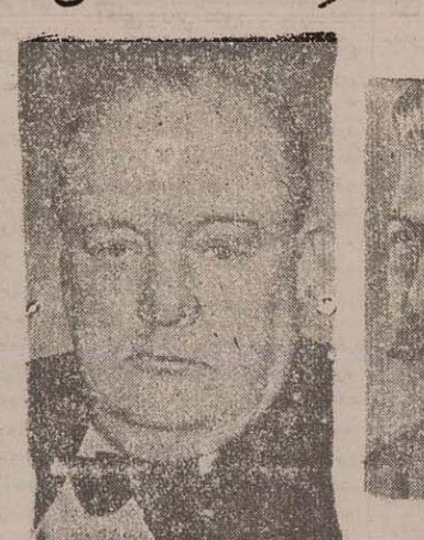
استالین رئیس دولت اتحاد جماهیر شوروی