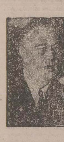
ووژول رئیس جمهوری امریکا