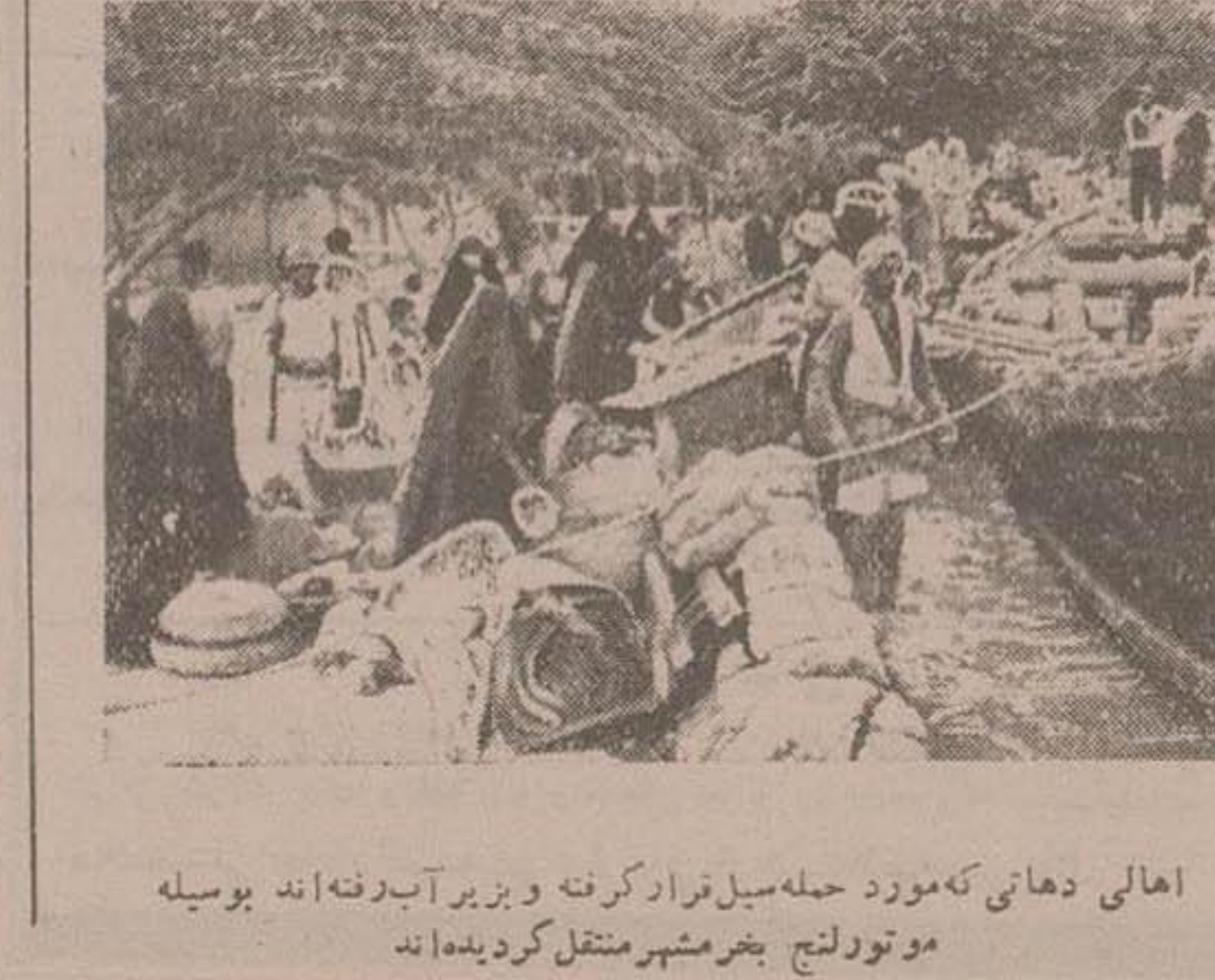
اهالی دهاتی که مورد حمله سیل قرار گرفته و زیر آب رفته اند بوسیله موتورلنج بجز مشهر منتقل گردیده اند