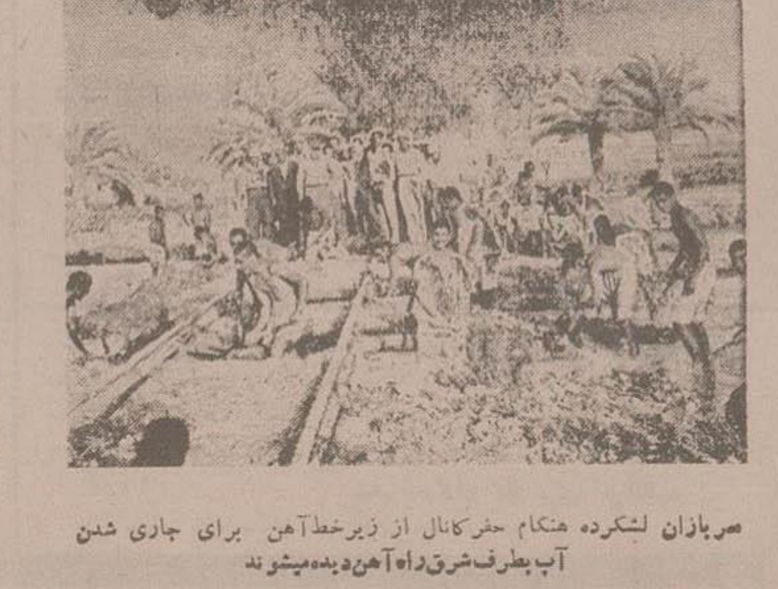
سربازان لشکرده هنگام حفر کانال از زیر خط آهن برای جاری شدن آب بطرف شرق راه آهن دیده میشوند

تیسار سرتیب کمال استاندار خوزستان از عیایات حفر کانال برای تغییر مسیر سیل که بوسیله سربازان لشکرده اهواز انجام گردیده باز دیده میکنند در طرف دیگر سربازان هنگام حمل کبسه های شن برای استحکام سد خرمشهر دیده میشوند