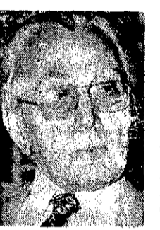
دکتر کریم سنجابی

جبهه ملی ایران شب گذشته بشارت‌نامه‌ای در مورد بازگشت امام خمینی به وطن انتشار داد. در این بشارت نامه آمده است: مردمی که در این بشارت‌نامه شریک شده‌اند، به این امید که مردم را از این بشارت‌نامه بی‌خبر نگه دارند، سعی می‌کنند که مردم را از این بشارت‌نامه بی‌خبر نگه دارند. اما ما می‌دانیم که مردم از این بشارت‌نامه بی‌خبر نخواهند ماند. ما می‌دانیم که مردم از این بشارت‌نامه بی‌خبر نخواهند ماند. ما می‌دانیم که مردم از این بشارت‌نامه بی‌خبر نخواهند ماند.