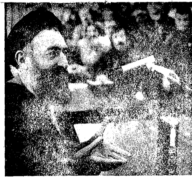
آزادی عقیده و بیان مؤمن هستند. در این دنیا ما با هم هستیم. ما می‌دانیم که ما با هم هستیم. ما می‌دانیم که ما با هم هستیم.

من اینجا با صراحت می‌گویم ای هموطن مار کمیسیت یا طرفدار سایر رژیم‌ها، ما نمی‌توانیم با شما همکاری کنیم. ما می‌دانیم که شما با ما همکاری نمی‌کنید. ما می‌دانیم که شما با ما همکاری نمی‌کنید. ما می‌دانیم که شما با ما همکاری نمی‌کنید.