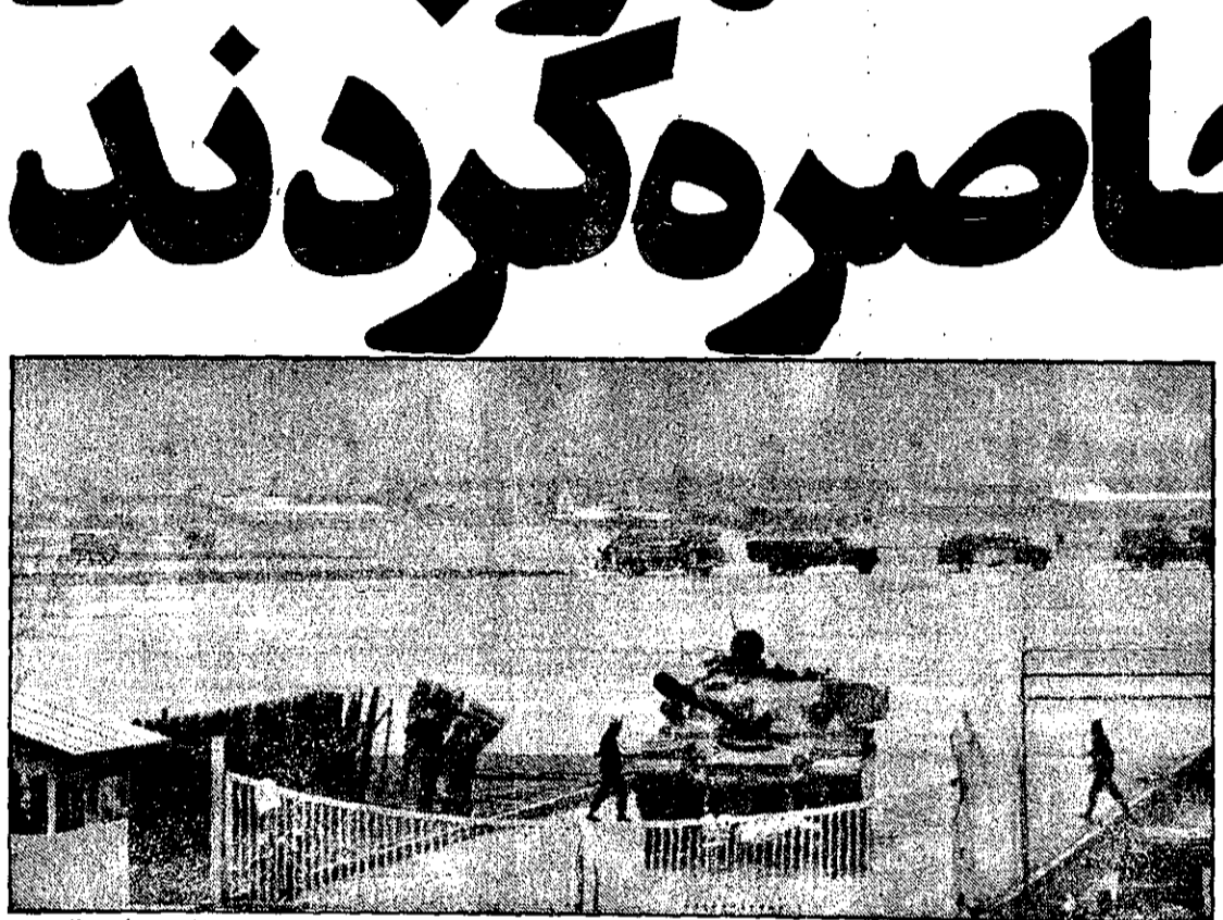
بجای اشغال نظامی - این عکس که صبح امروز از فاصله دور گرفته شده است، تانک، مأموران مسلح نظامی، اتمیلهای آتش‌نشانی را در بناد فرودگاه مهرآباد نشان میدهد. فرودگاه مهرآباد دیشب به اشغال مأموران نظامی درآمد و کلیه پروازهای آن لغو شد.