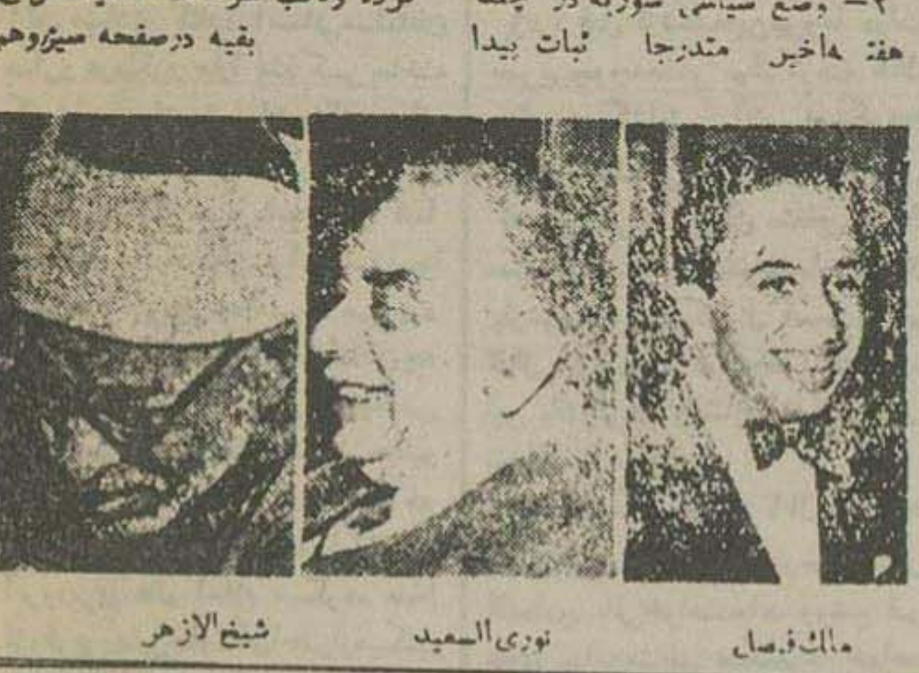
شیرین لایزهر، نوری السعید، مالک فیصل

رادیو قاهره دیشب ایراد بنسبته حوادث کرد بلا و نجف بدولت عراق اعتراض کرد عربستان اعلام کرد که دوباره روابط سیاسی با انگلیس و فرانسه برقرار میکنند. لبنان از تمرکز طیاره های شوروی در سوریه سخت نگران شده است. در بحرین زندانیان سیاسی اعلام اعتصاب غذا کردند - علمای شیعه حیل عامل سوریه از علمای ایران برای کمک بعلمای عراقی استمداد نمودند مجلس اردن طی قطعنامه ای از ملک فیصل پادشاه عراق تقاضا کرد که عراق از بیمان بغداد خارج شود