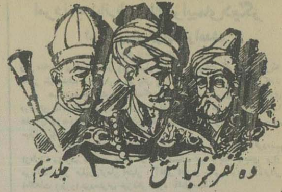
وه نفر فریب است جلد سوم