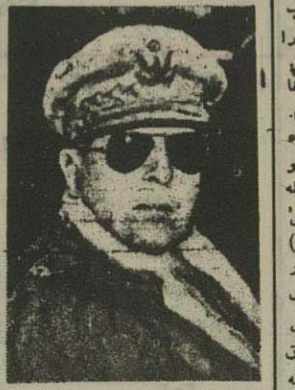
مک آر تونر