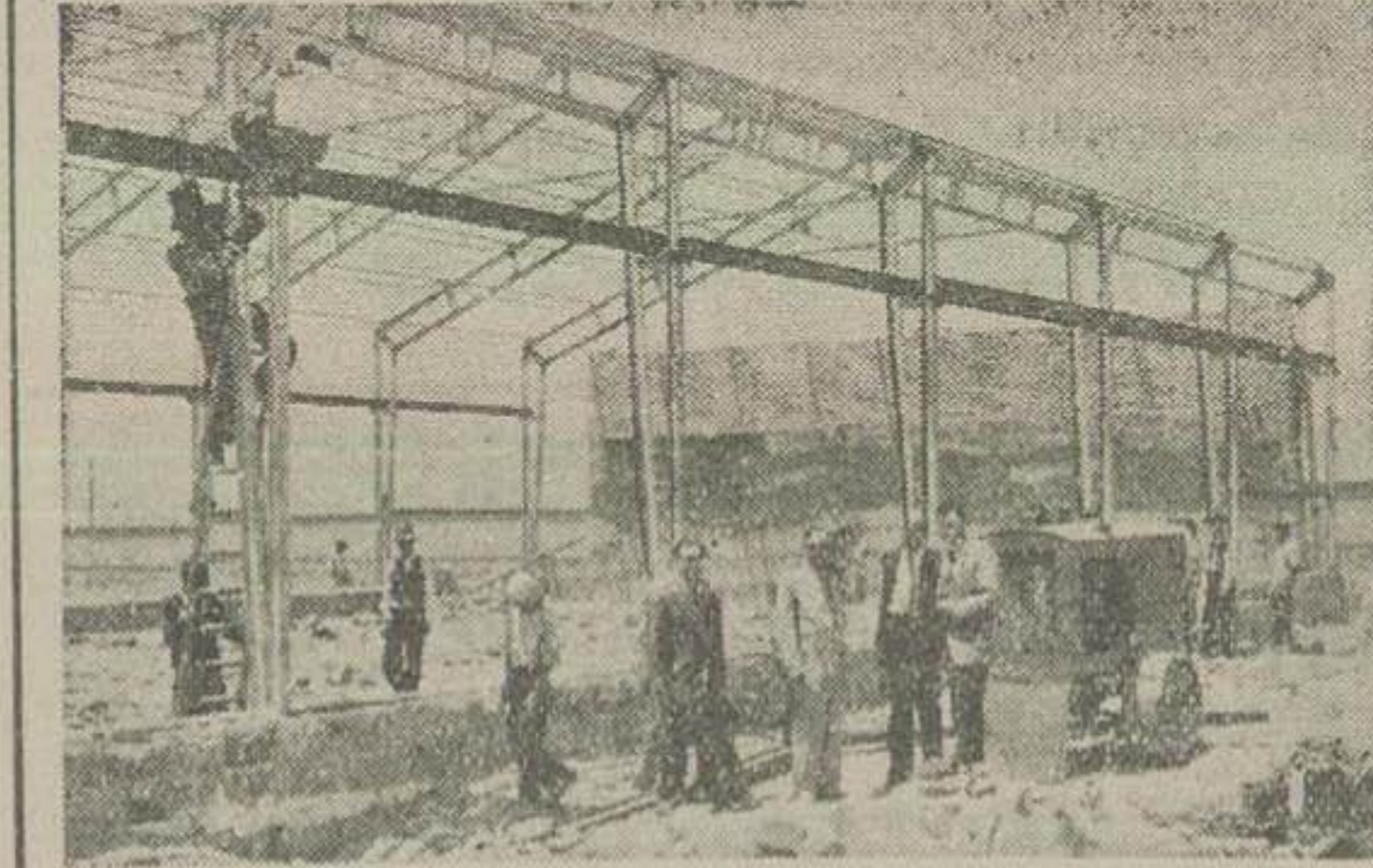
آقای وزیر بهداری و همراهان هنگام بازدید عملیات ساختمانی کارخانه شیر پاستوریزه

ضیافت دیشب تا پاسی از شب گذشته ادامه داشت و از طرف آقای بالچ از معزین پذیرائی بعمل آمد