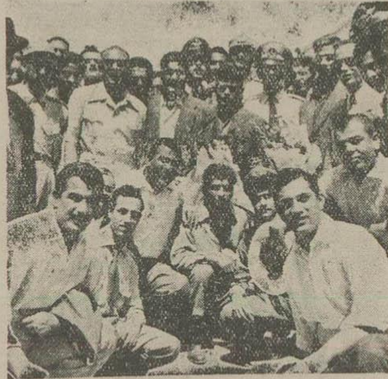
کشتی ایران هنگام مراجعت در فرودگاه مهر آباد در میان استقبال دیده میشود

سه نفر از اعضای تیم ملی کشتی به تهران وارد شدند