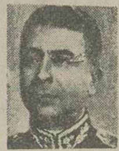
سرلشکر کرزن وزیر راه