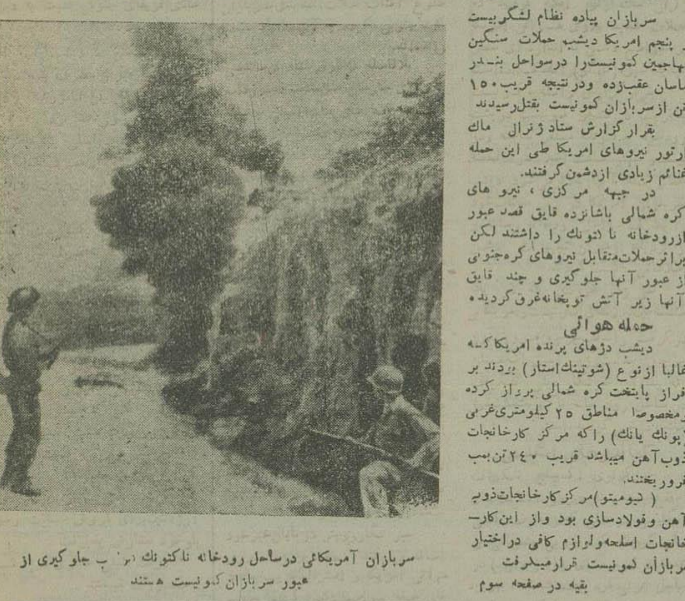
سربازان امریکائی در ساحل رودخانه ناکتوک در پجاوگیری از عبور سربازان کمونیست هستند

سربازان پیاده نظام لشکر بیست و پنجم امریکا در شب حملات سنگین مهاجمین کمونیست را در سواحل بندر ماسان عقب زده و در نتیجه قریب ۱۵۰ تن از سربازان کمونیست بقتل رسیدند.