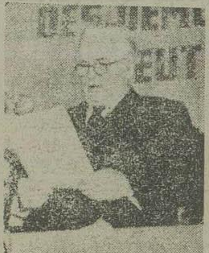
ویلیم پیک رئیس جمهور آلمان شرقی

آنکارا - نخستین دسته قوای اعزای ترکیه بکسره در طرف هفته اول ماه سپتامبر بوسیله هواپیمای بکره حرکت کرده و در آنجا به نیروی ملل متحد خواهند پیوست. این قافله که عبارت از ده نفر افسران قوای اعزای است فعلاً برای جابجایی کردن ترتیبات فرماندهی خود بکسره خواهند رفت و پس از دادن گزارش قوای ترکیه بگروه اعزام خواهند شد.