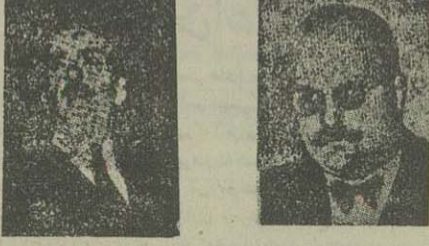
ملک فاروق اتونی ایتن

ایتن وزیر امور خارجه انگلیس واستسن سفیر کبیر آن دولت در قاهره هر دو مبتلا بر ما خود دگی شده اند۔ مذاکرات انگلیس و مصر بطور غیر مستقیم زیر نظر فاروق - ایتن اداره میشود ممکن است پارلمان مصر منحل و انتخابات تجدید گردد علا - استغای ماهر باشا اکنون فاش گردیده است