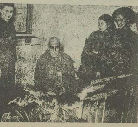
چهار نفر از دوشیزگان دانش آموز پریش سنز آل آقای نخست وزیر بر قبه و یک قاب عکس و یک گلن گل با چشمان همدم نهوده

طرح تهیه برنامه حقوق اسفندماه در دست تهیه است اقدامات کمیسیون تقبیل بودجه تقریباً خاتمه یافته در آمد فعلی دولت تا مین منداجات ضروری آنرا می نماید لیستهای عیدی قبل از طرف ادارات دولتی و وزارتخانه ها و ادارات دولتی برای پرداخت عیدی مستخدمین جزء تهیه گردیده بود در این چند روزه مورد مطالعه اداره کل بودجه قرار گرفت و مصبح امروز دستور پرداخت عیدی مستخدمین جزء از طرف وزارت دارائی بصیاداری ادارات صادر گردید و بقرار اطلاع در چند اداره نیز پرداخت عیدی کارمندان جزء شروع شده است. یک مقام مطلع امروز در وزارت دارائی بخبر نگار ما اظهار داشت چون لیستهای عیدی از طرف ادارات برای عیدی مستخدمین جزء تهیه میگردد بتدریج بدست مامورین وزارت دارائی نیز بترتیب وصول، دستور پرداخت