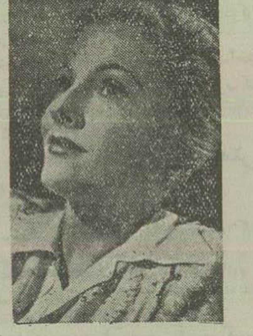
شاهکار عشقی نمازنگی و شیرین