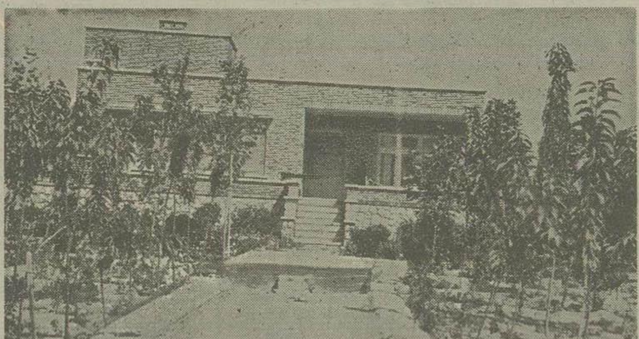
در عکس بالا و محوطه خارجی منزلی که در «داوید» قلهک در زیر زمین مردموز آن چاپخانه مجهز حزب منتهی توده قرار داشت دیده میشود

ساعت پنج و نیم بعد از ظهر روز گذشته علیاحضرت ملکه تریا پهلوی ریاست عالی جمعیت خیریه تریا پهلوی برای بازدید از اقدامات و فعالیت های جمعیت بعجل جدید جمعیت واقع در صارت مرحوم سر لشکر بوذرجمهری تشریف فرما شدند. ابتدا خانم فروغ ظفر نایب رئیس اول جمعیت ضمن عرض خیر مقدم گزارش جامعی از فعالیت های جمعیت را به عرض داشت. سپس خانم زاهدی هسر آقای نخست وزیر نایب رئیس دوم جمعیت و رئیس کمیسیون بهداشت اقدامات دو ماهه کمیسیون بهداشت را به عرض رسانید و در خانه از پیشگاه علیاحضرت تقاضا نمود بودجه ای در اختیار کمیسیون مزبور گذاشته شود تا یک پرورشگاه و یک بیمارستان و چند درمانگاه برای معالجه و مداوای مستمندان تأسیس شود. بعد خانم آقای مهندس مصطفی زاهدی که ریاست کمیسیون خود را جمعیت خیریه تریا پهلوی را بعهده دارند پس از شرح اقدامات گذشته بقیه در صفحه دهم