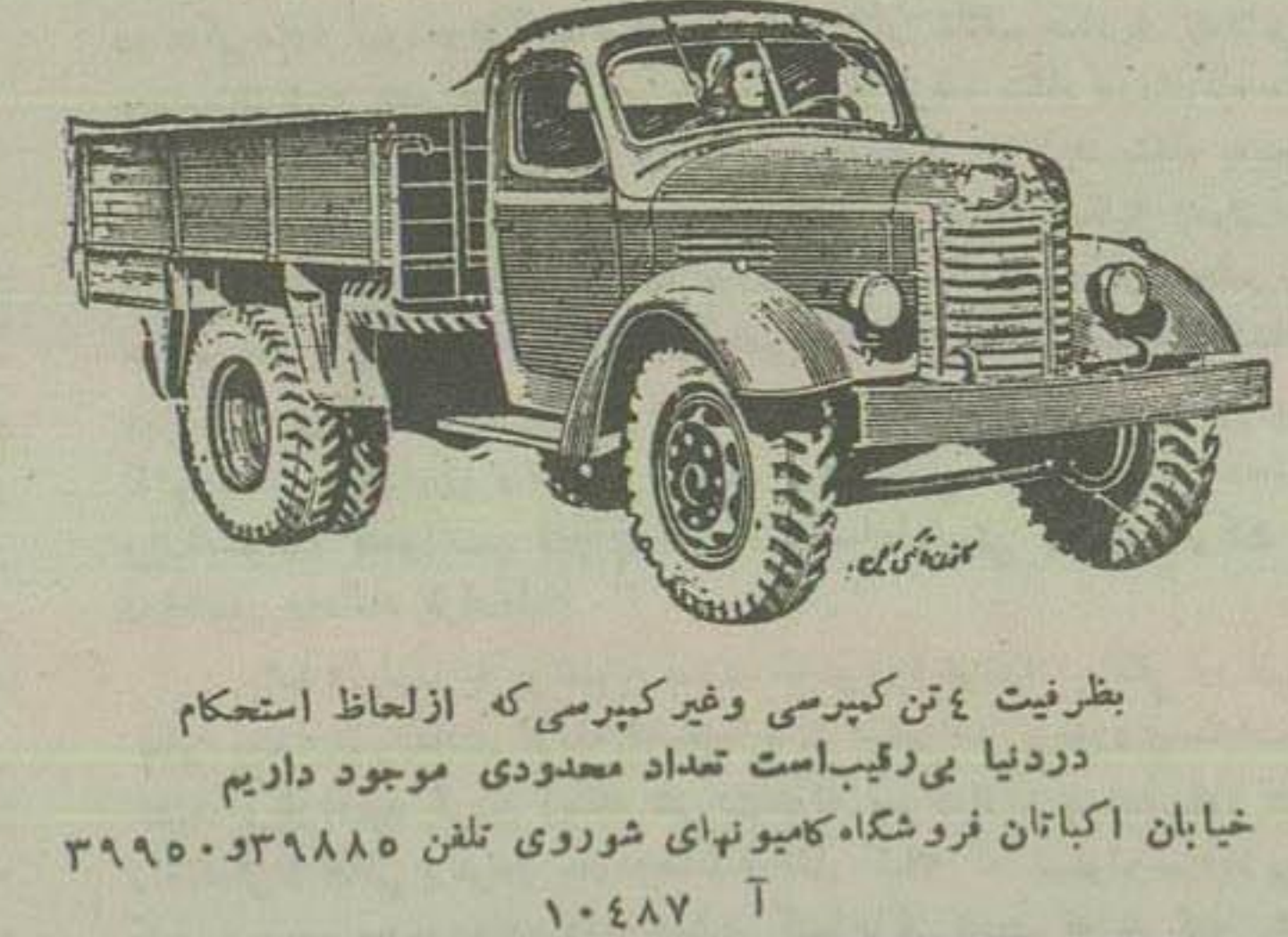
شیابان اکباتان فروشگاه کامیونهای شوروی تلفن ۳۹۹۰۰ و ۳۹۸۸۰ ۱۰۴۸۷

بظرفیت ۴ تن کبیری و غیر کبیری که از لحاظ استحکام در دنیا بی رقیب است تعداد معدودی موجود داریم