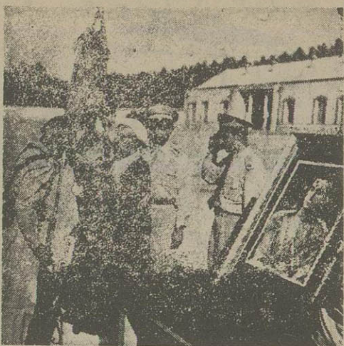
سربازان جدید پس از اخذ سردوشی قرآن مجید را میسویسند.

ساعت هفت صبح امروز مراسم تحلیف واخذ سردوشی سربازان جدید در حضور تیسار سرتیپ آریانا فرمانده لشکر گارد شاهنشاهی بعمل آمد و سپس مراسم سوگند توسط قاضی عسکر لشکر گارد شاهنشاهی انجام شد بعد از مراسم سوگند فرمانده لشکر بیاناتی در اطراف وظیفه سربازان ایراد نمود و سپس مراسم رژه در مقابل تماشا علیحضرت «مابون شاهنشاهی انجام شد و مراسم مزبور ناساعت نه ادامه داشت.