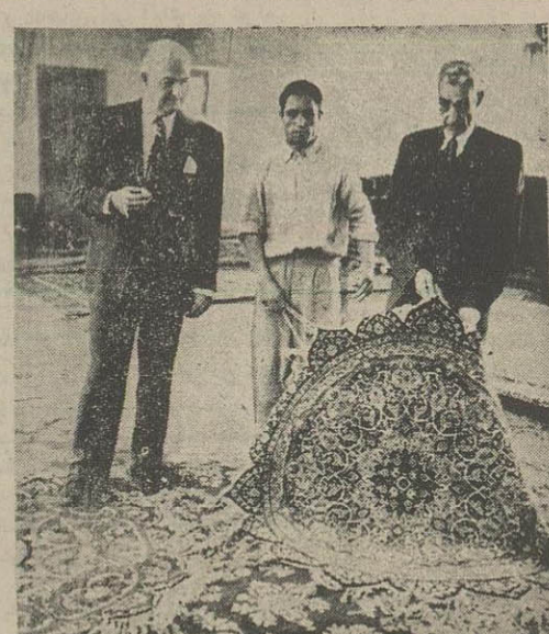
ساعت یازده صبح امروز مستر (جنوز) برای بازدید و خرید فرش شرکت فرش رفت و بعد از آنکه مقدار زیادی از فرش ها را دید هشت قطعه از فرش های بافت تبریز و اصفهان و کرمان و کاشان را بپشت کرد و باضانه دو عدد فرش رومیزی جلکی ایتباع نمود. بپای فرشیهای مزبور در حد دو ساعت و پنج هزار تومان میبایشد

رقابتی که میان شرکت «سیتیز سرویس» و شرکت های دیگر نفت آمریکایی بر سر نفت ایران شروع شده است در دو جلسه سری ملاقات نخست وزیر و سفير آمریکا و کاردار انگلیس چه گذشت؟ گزارش مصوری از پیروزی نهرمانان ایران در بلژیک با زیارتین و خوش مشرب ترین و کلا مجلس آشنابود این مطالب را بهترین داستانها و سر کیمیا داده ها مقالات دیگر در اطلاعات هفتگی فردا خواهید یافت