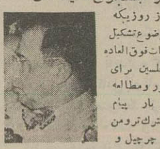
در جستجوی نمایندگان

ملاقات آقای المهباز صالح ناویر اقتصاد ملی ساعت ۸ صبح دیروز آقای المهباز صالح سفیر کرای ایران در آمریکا که فرار است هفته آینده بصوب ماموریت خود عزیمت نماید در وزارت اقتصاد ملی حضور یافت و در ضمن ملاقات و مذاکراتی که بین ایشان و آقای دکتر اخوی وزیر اقتصاد ملی صورت گرفت. قرارداد آقای صالح درواشکنند در مورد تخفیف تره های کمرکی برای صادرات انگلیس فریمان و آمریکا درباره موضوع نفت بمیان آمده است تمام وقت ادارات بازرسی هر دو مجلس صرف توزیع کارت دعوت و معاشرت تکرار فوری شهرستانها و کشور های خارج میشود تا عهده نمایندگان برای تشکیل جلسات مجلسین بعد کفایت برسد.