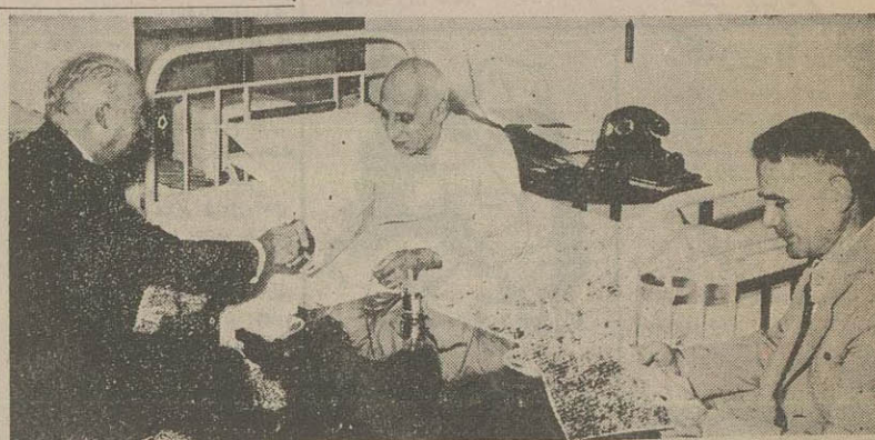
مستر جونز هنگام ملاقات و مذاکره با آقای دکتر مصدق. آقای مهندس پرخیده نیز در این عکس دیده میشود

چند شاهکار ادبی از هیئت سادات، مسرور، شفا و سایر نویسندگان و دانشمندان پشت جلد و روی جلد و هدیه ماه این شماره بی نظیر است. مجله اطلاعات ماهانه را روز یکشنبه تهیه فرمای!