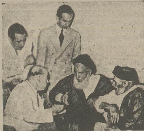
آقای سید عبدالحمید شرف الدین رئیس شیعیان سوریه و لبنان در مدت توقف کوتاه حضرت آیت الله کاشانی در لبنان، بملاقات معظم له رفته و مذاکراتی بعمل آورد. در عکس بالا حضرت آیت الله کاشانی و آقای سید عبدالحمید شرف الدین و آقای پورالی وزیر مختار ایران در بیروت دیده میشوند.