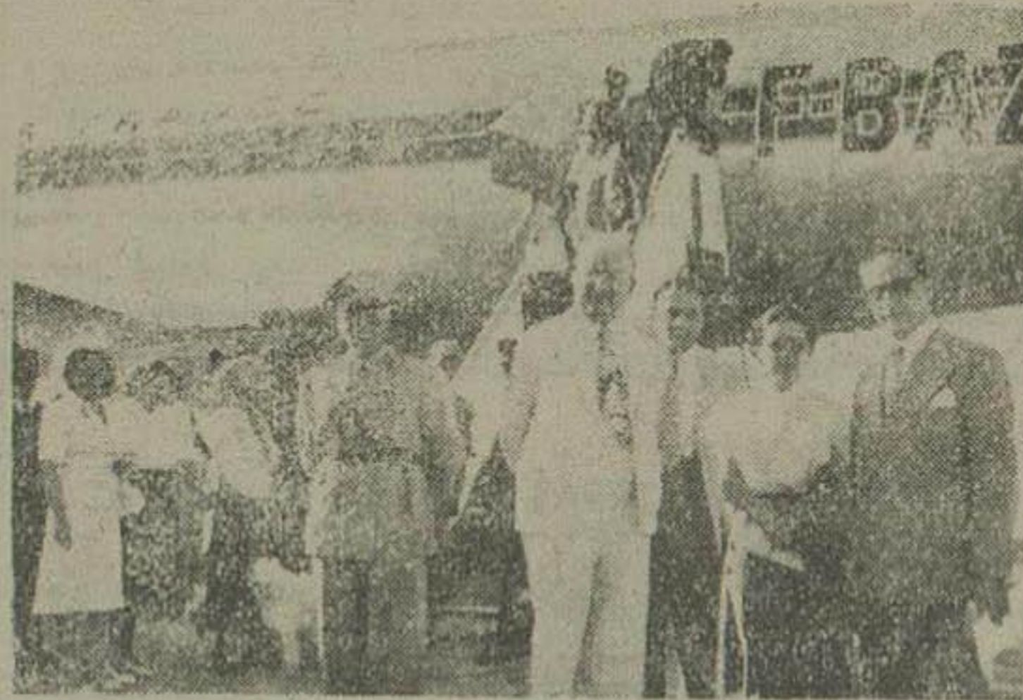
بروزی در محفل علمی... بروزی در محفل علمی... بروزی در محفل علمی...