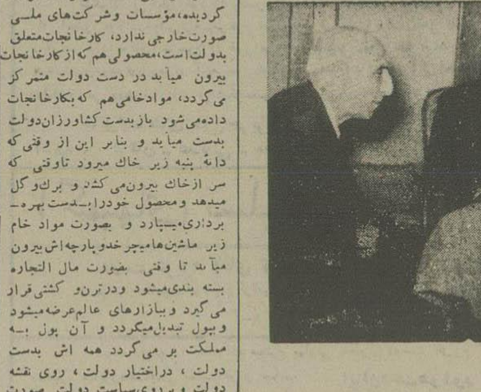
امروز با یروود با یروود سفير کير امریکا از دکتر مصدق ملاقات کرد

با یروود در سفارت امریکه گفتار سیاسی و نظامی تشکیل داد و یادداشت هائی تهیه گردید مذاکرات امروز نخست وزیر و با یروود در محافل سیاسی مهم تلقی شد در جلسه ملاقات دکتر مصدق و معاون وزارت امور خارجه امریکا یکبار دیگر سکوت حکامه ما بود. سفير امریکا ظهر امروز با انتخابار با یروود ضیافتی بنا نهاد داد