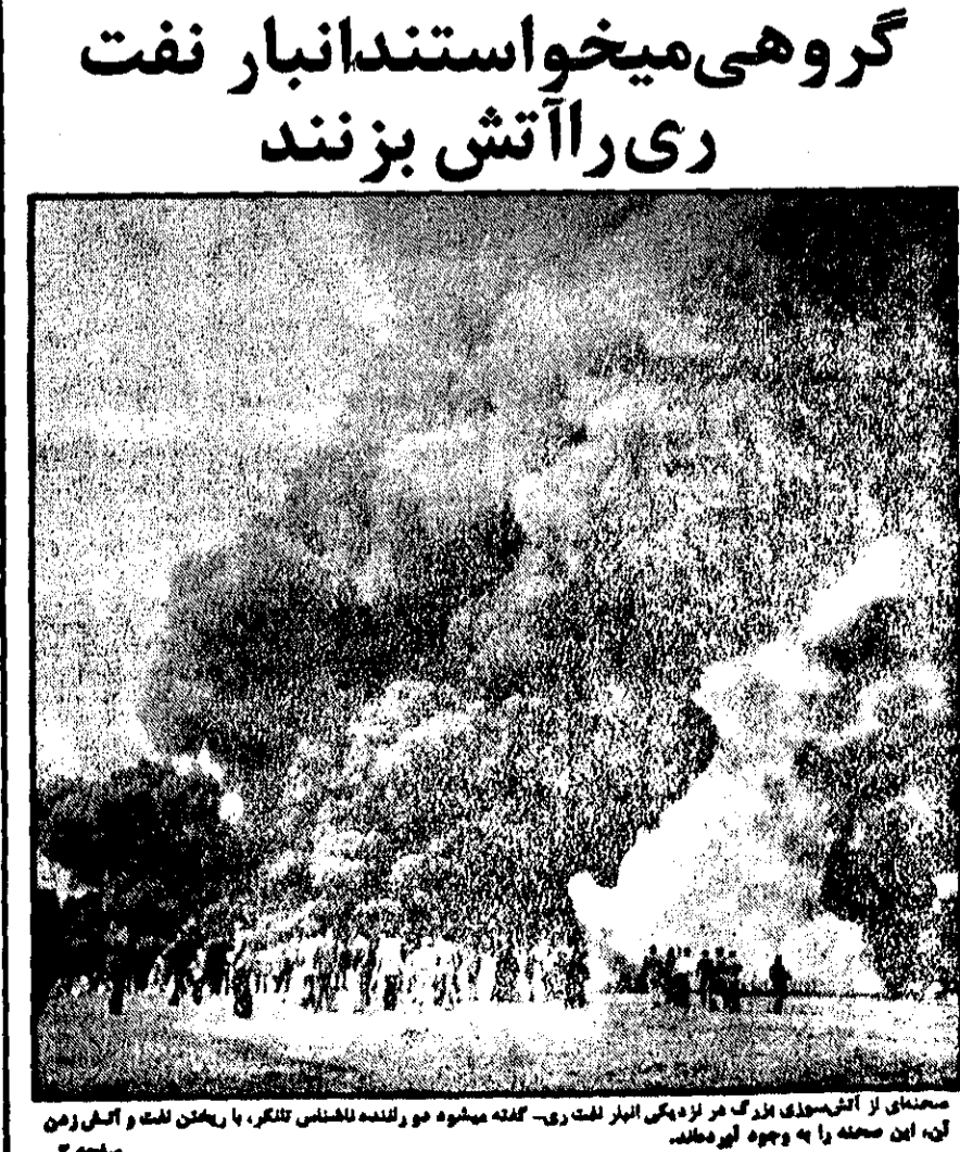
مستعین از آنستند، بزرگ در زنده یکی از ارتش روی - گفته میشود می‌راندند لاشتنی تانکر، با یکن لکت و آکسی زدن این صحنه را به وجود آورده اند.

ارتش چرا کودتا کند؟ در حدی لیستند که بتوانند روی انضباط و یکپارچگی ارتش اثر بگذارند، و نباید اجازه داد که اعمال زیر جلی آنها در میان افکار عمومی اثر بد بگذارد. زیرا محصول اشکبار و احساسات اینان، تغییر شرایط و احوال موجود نخواهد بود، بلکه خطری را به جانب پیوند ملی ارتش سوق می‌دهد، که سواد نصاب بیگانگان و زینت متوجه کشور ما خواهد شد. ارتش نمی‌تواند از مردم جدا باشد، زیرا لکتک سربازهای دیگرش، با مردم گره خورده است. سربازانش، افسران و آزادیهای بنیانی وجودش، از مردم جدا نیستند و به صلت تلقی دارند. در سطحی نیست که مداخله ارتش بتواند باساختگی آنها باشد، و اگر قرار بود کارها به این آسانی سامان پذیرد، این یکسال و نیم یا دو سال پرخواب و پرتلاطم و هیجان بر کشور ما نمی‌گذشت. خصلت ارتش حساس و سرگشته فرستادن و درگیریهایی سیاسی داخل کشور نیست، و ارتش ما را به مصلحت کشور و به مصلحت ارتش، باید از حضور در خارج و جریانهایی سیاسی و درون شهری، و آلوده شدن به جریانهایی سیاسی مابعد و دور نگاه داشت. این حکم عقل است که فردا و هیچ روز دیگر، ارتش خود را به درگیری در مسائل سیاسی داخلی کشور آماده نسازد، و دلیلی وجود ندارد که گمان بریم فرماندهی عالی ارتش، راهی جز این بر این قرار دهد، حتی اگر موجودیت و منافع و موقع چند متهم متمم از مواهب یادآورده سالهای گذشته، به مغایره مصلحت ما به بازخواست دادگاه و عدالت بماند. و هرگز کسی جز این یک خطای نابهنشودنی است که تاریخ فردا از آن، به خامی مقدمان آن یاد خواهد کرد.