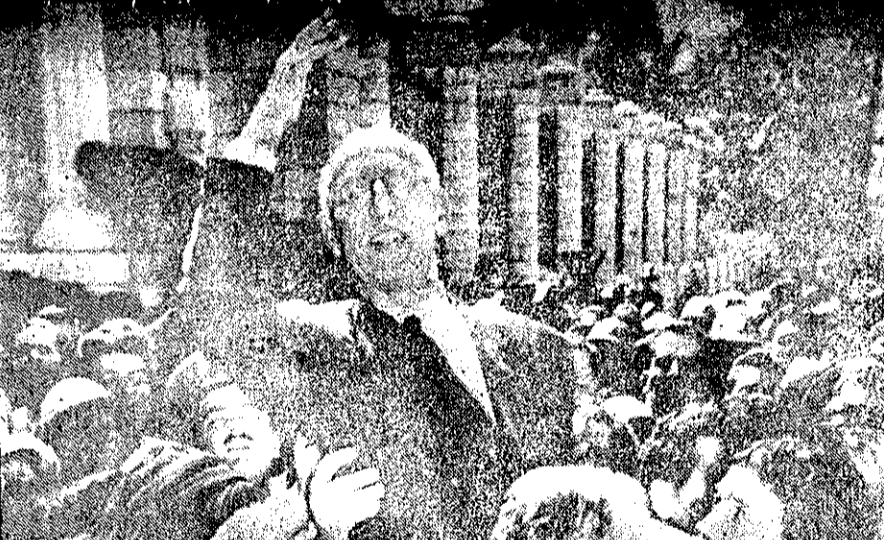
هرجا ملت است، مجلس آنجاست - این عکس تاریخی امروز به مقدار وسیع در کیهان پخش شد. عکس لحظه‌ای از نشان میدهند که مصدق پس از اختلاف با مجلسی که هنوز زیر سیطره فئودالها و ارجاسیون بود، بیان مردم آمد و اعلام کرد و هرجا ملت است، مجلس آنجاست.

ارتش چرا کودتا کند؟ در حدی لیستند که بتوانند روی انضباط و یکپارچگی ارتش اثر بگذارند، و نباید اجازه داد که اعمال زیر جلی آنها در میان افکار عمومی اثر بد بگذارد. زیرا محصول اشکبار و احساسات اینان، تغییر شرایط و احوال موجود نخواهد بود، بلکه خطری را به جانب پیوند ملی ارتش سوق می‌دهد، که سواد نصاب بیگانگان و زینت متوجه کشور ما خواهد شد. ارتش نمی‌تواند از مردم جدا باشد، زیرا لکتک سربازهای دیگرش، با مردم گره خورده است. سربازانش، افسران و آزادیهای بنیانی وجودش، از مردم جدا نیستند و به صلت تلقی دارند. در سطحی نیست که مداخله ارتش بتواند باساختگی آنها باشد، و اگر قرار بود کارها به این آسانی سامان پذیرد، این یکسال و نیم یا دو سال پرخواب و پرتلاطم و هیجان بر کشور ما نمی‌گذشت. خصلت ارتش حساس و سرگشته فرستادن و درگیریهایی سیاسی داخل کشور نیست، و ارتش ما را به مصلحت کشور و به مصلحت ارتش، باید از حضور در خارج و جریانهایی سیاسی و درون شهری، و آلوده شدن به جریانهایی سیاسی مابعد و دور نگاه داشت. این حکم عقل است که فردا و هیچ روز دیگر، ارتش خود را به درگیری در مسائل سیاسی داخلی کشور آماده نسازد، و دلیلی وجود ندارد که گمان بریم فرماندهی عالی ارتش، راهی جز این بر این قرار دهد، حتی اگر موجودیت و منافع و موقع چند متهم متمم از مواهب یادآورده سالهای گذشته، به مغایره مصلحت ما به بازخواست دادگاه و عدالت بماند. و هرگز کسی جز این یک خطای نابهنشودنی است که تاریخ فردا از آن، به خامی مقدمان آن یاد خواهد کرد.