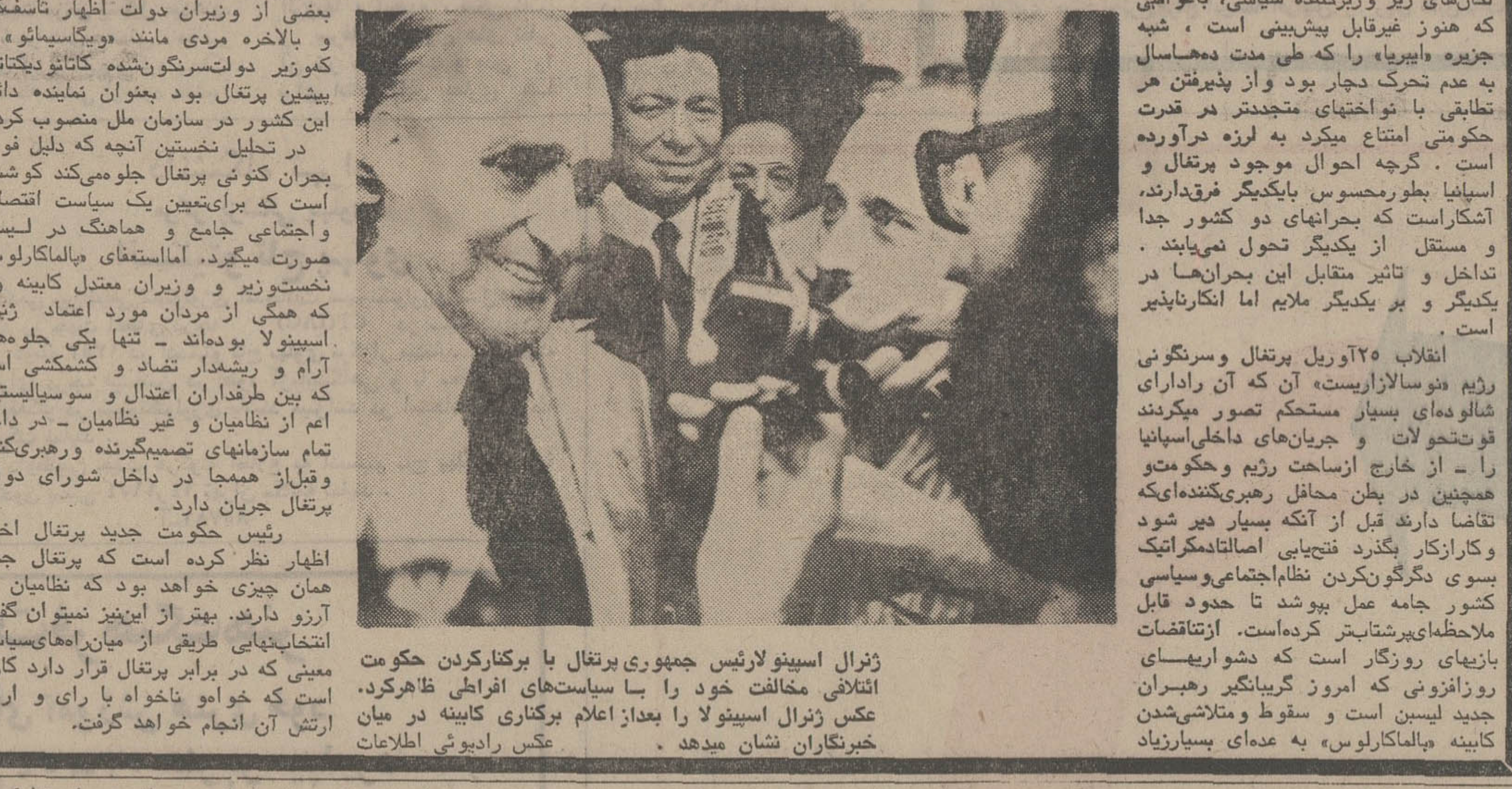
ژنرال اسپینولا رئیس جمهور برتغال با پرکنارکردن حکومت ائتلافی مخالفت خود را با سیاست‌های افراطی ظاهر کرد . عکس رادیویی می‌دهد .

مقاموموق اسپینولا بعنوان رئیس جمهور برگزیده رژیم جدید او را ابتدا تا مدتی و آدار کرد که سکوت بیشه کند - سکوتی که می‌توانست بمعنای تابید و رضایت تلقی شود . اما اسپینولا از سرعت بقول برخی آروزیران برتغالی - از شتابزدگی سراسیم‌کننده‌ها که مایوسواروزر رهبر اینهم صورت گرفته است افسران جوان برتغالی که اعضای نهضت نیروهای مسلح و تنها مسئولین قیام ۲۵ آوریل بشمار میروند آرزو داشتند که تمام آثار حکومت سالارزاری محو شود و برای پایان دادن سریع به جنگ استعماری برتغال - مذاکره با رهبران جنبش‌های آزادیبخش و استقلال طلب مستعمرات آغاز گردد . افسران برتغالی مطمئنا به این دلیل ژنرال اسپینولا را به رهبری خوانند که او بعنوان فرمانده سابق نیروهای برتغالی در گینه بیسائو میتوانست نهضت انقلابی برتغال را آمیترت و برابستر کند . اما ژنرال اسپینولا هرچه طرفداران توفیق و تقام در تمام زمینه‌هاست - منعلک از قول تمام نظریات و فرضیات افسران جوان و دوستان رهبران احزابیج کنگرهایارده سیاسی دارند تا حدودزیادی کلامه دارد .