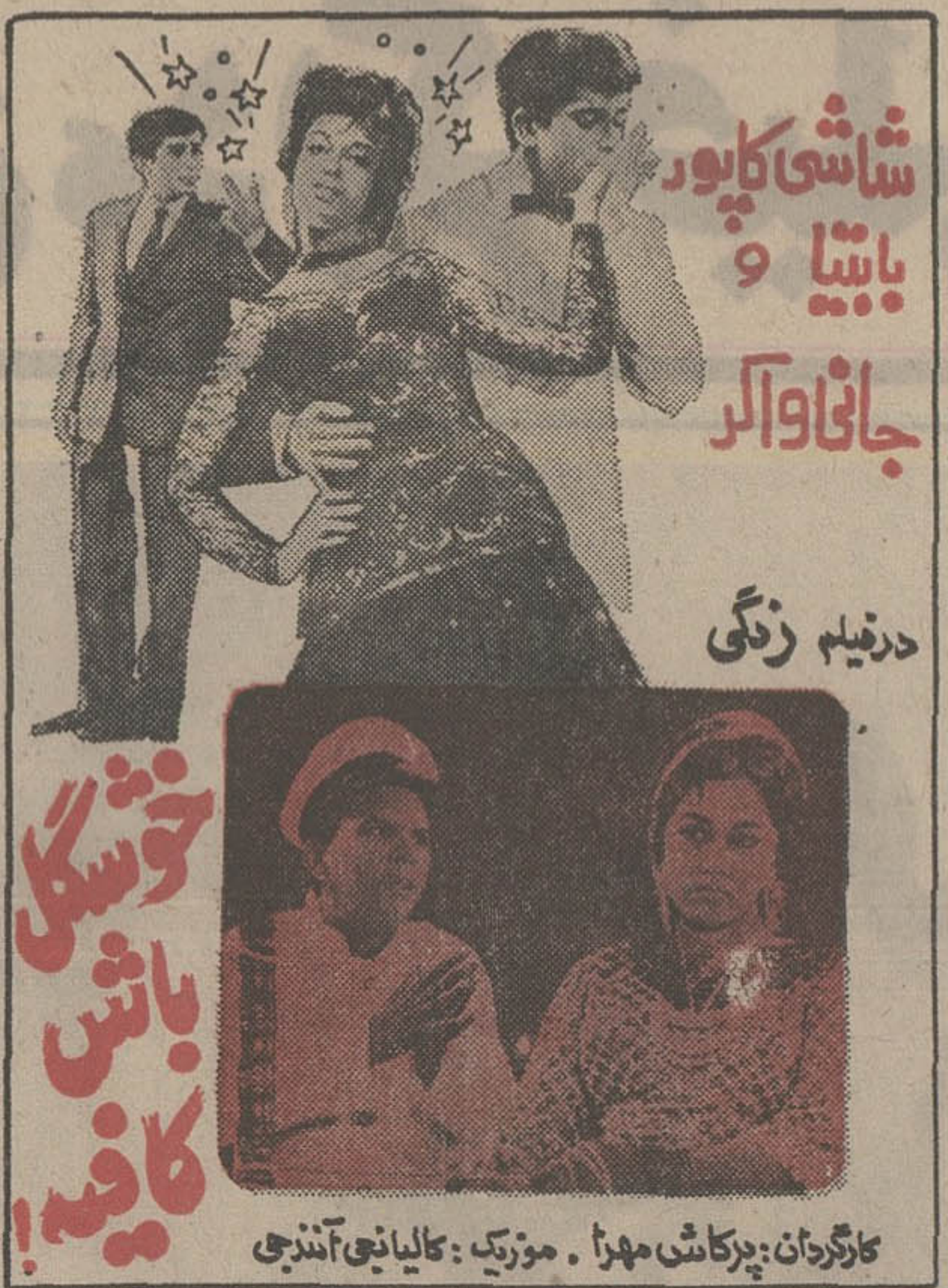
شاشی کاپور و بینا

یک فیلم شاد از سینمای هند توام با بهترین آهنگ های نشاط انگیز که هرگز فراموشش نخواهید کرد.