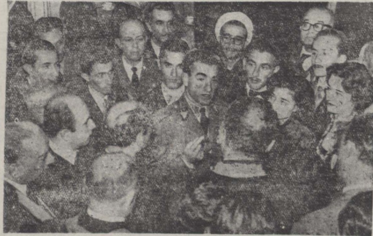
پس از انجام مراسم اعطای جوایز و در تالی صرف چای استادان و دانشجویان در حضور ملو کانه ، شاهنشاه بیاناتی خطاب با استادان و دانشجویان ایراد میفرمایند

ساعت چهار بعد از ظهر روز پنجم به مناسبت مراسم شرفیائی استادان دانشگاه تهران و شاگردان اول دانشکده ها بحضور ملو کانه انجام گردید قبل از ساعت مقرر استادان و دانشجویان در تالار آئینه کاخ مرمر حضور یافتند و انتظار تشریف فرمائی اعلیحضرت همایونی ایستادند. در حدود دو ساعت فرآیند شرفیائی شرفیابی اسامی از جهت باسالیهای بقیه در صحنه دهم