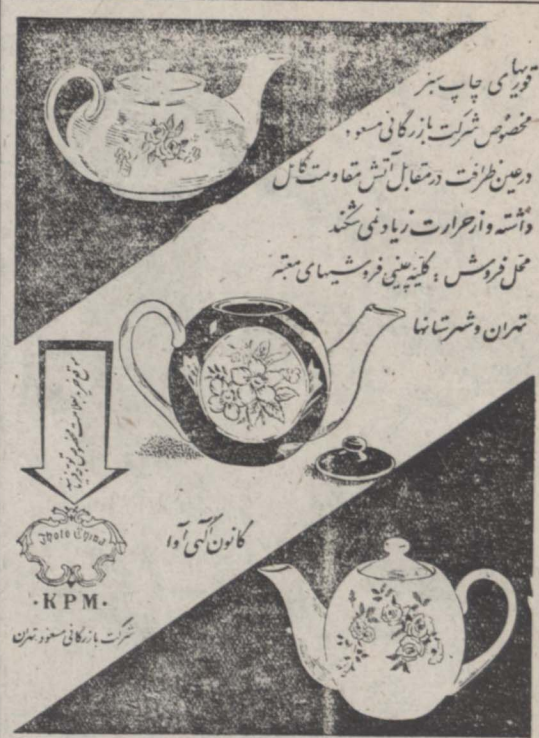
کانون آسی آوا

تبریز - در مصاحبه مطبوعاتی که پیش از ظهر امروز در دفتر ستاد آذربایجان تشکیل شد آقای رئیس شهربانی با اشاره بامور انتظامی شهر از مبارزات مأمورین با مخالفان گران و وابستگان حزب منحل توده سخن میان آورده اظهار داشت: در مأموریت اخیر خود که وارد تبریز شد این نکته توجه مرا جلب کرد که فعالیت عناصر توده بسیار فعال است و پیش از آنکه دست ریاست شهربانی آذربایجان را داشته ام در اینجا دامنه بیشتری یافته و شاید در نتیجه آزادی عملی که از دو سال پیش داشته ام تقویت کرده اند. این بود تصمیم گرفتم مبارزه شدیدی علیه این قبیل عناصر مزدور شروع کنم و بهر تریبی هست از فعالیتشان جلو نریزم و بطوریکه ملاحظه می کنید در این مدت موفقیتهای زیادی نصیب مأمورین انتظامی گردیده و نشان زیادی که از راههای مختلف دست به اقدامات خلاف قانون میزدند دستگیر و به مقامات قانونی فرستاده شده اند. سه روز پیش نیز با همکاری بنیادامه از اعضاء بسیار فعال و با احتمال قوی از سر دستگان حزب منحل توده میباشند دستگیر و اینک با اسناد و اوراق مهم زیادی که از منزلش پیدا شده است در دست شهربانی میباشد.