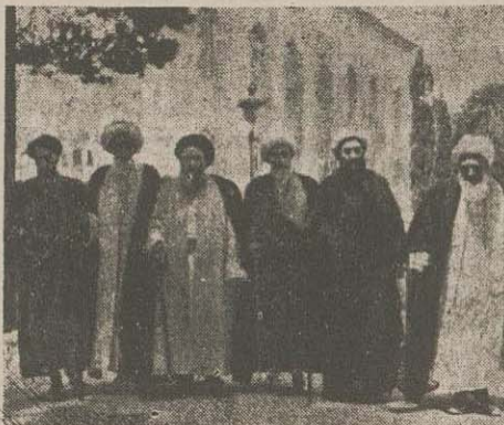
عده ای از آقایان روحانیون در شرفیابی عید مبعث