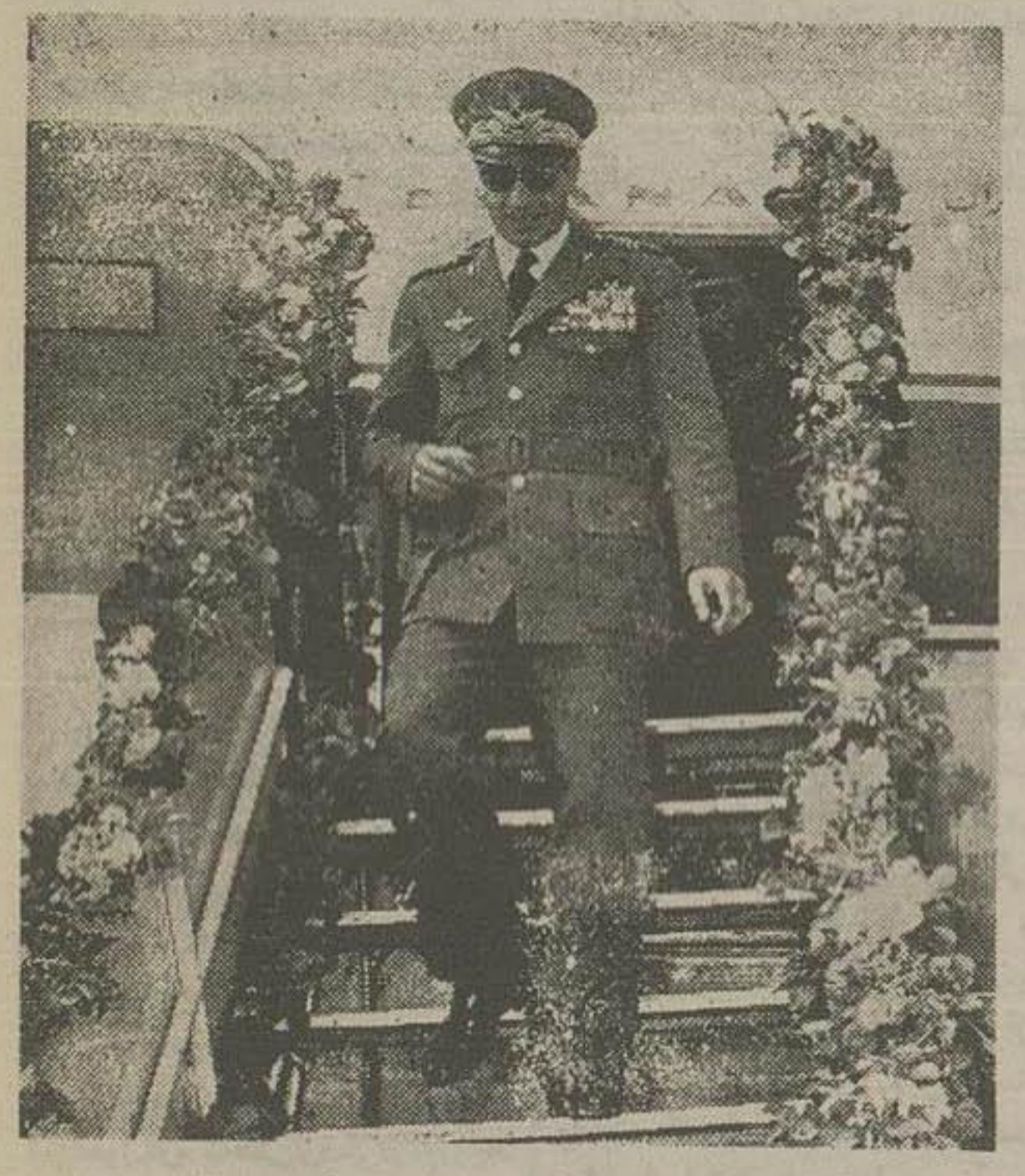
اعلیحضرت همایونی هنگام ورود به فرودگاه مهر آباد

بسم الله الرحمن الرحيم اعلامیه مشترک پادشاهان ایران و عربستان سعودی مناسبت دیدار اعلیحضرت همایون شاهنشاهی محمدرضا شاه پهلوی شاهنشاه ایران از اعلیحضرت ملک سعود پادشاه عربستان سعودی از دهم الی ۱۶ شعبان ۱۳۷۶ (۲۱ اسفند تا ۲۷ اسفند ۱۳۳۵) اعلیحضرتین از این فرصت استفاده نموده راجع بامور بین المللی و بخصوص درباره وضع خاور میانه که اهمیت خاصی بدان میدهند مذاکره و عمل آوردند.