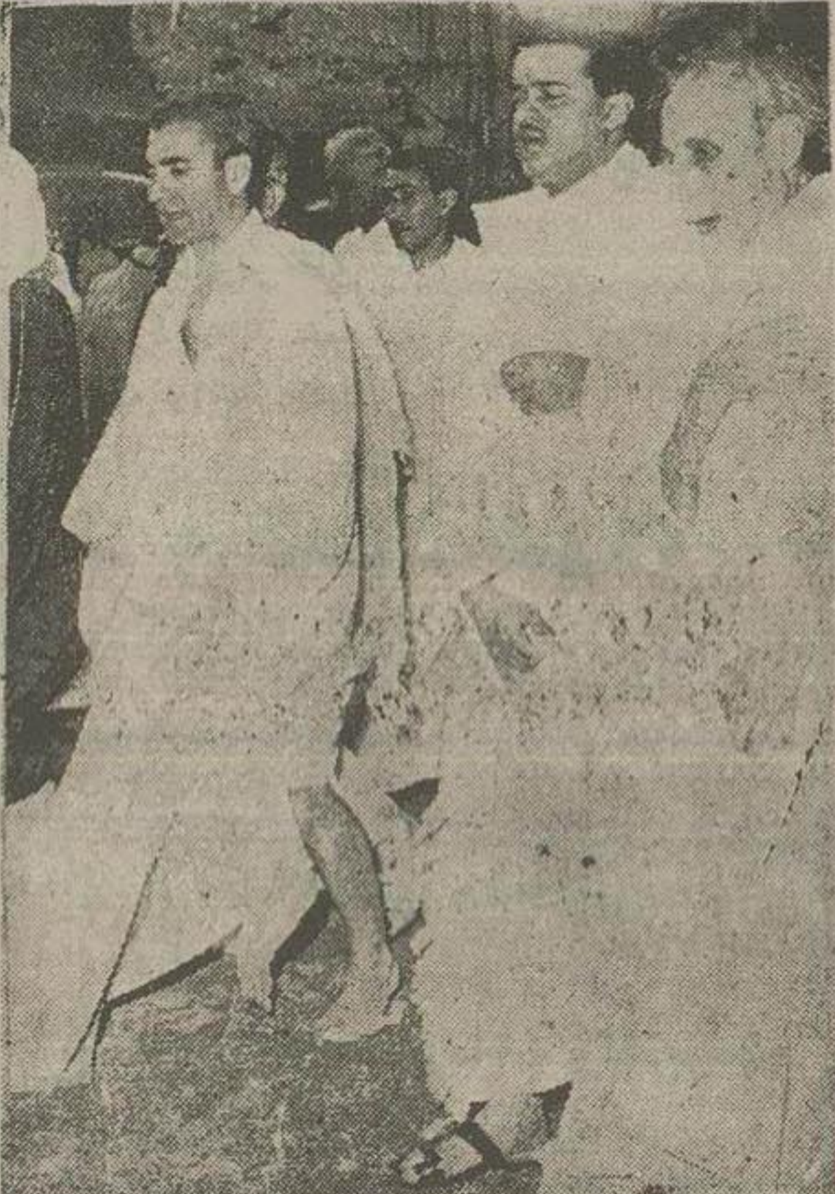
شاهنشاه و عده ای از ملتزمین با لباس احرام لحظه ای قبل از طواف کعبه

اعضای خاندان سلطنت - نخست وزیر و کلیه وزرا و نمایندگان مجلسین و نمایندگان سیاسی خارجی اعلیحضرت همایونی استقبال کردند - پادشاهان ایران و عربستان در اعلامیه مشترک خود اعلام داشته اند که: استقرار امنیت و صلح در خاور میانه منوط به برقراری آرامش و صلح در فلسطین میباشد - از مجاهدتهای سازمان ملل متحد در وقایع اخیر خاور میانه خوشنود معتقدند که ییداری ملل با سیاست استعماری مغایرت دارد