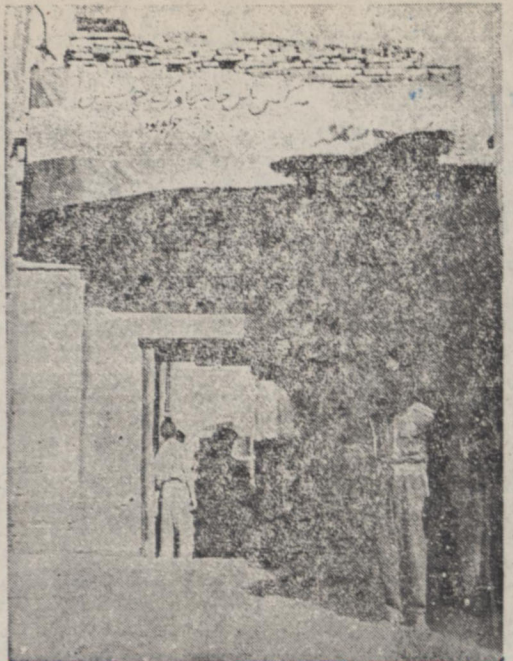
بالای سردر حزب زحمتکشان (دکتر قائمی) که نزدیک میدان بهارستان واقع است در روز برای دفاع در برابر حمله احتمالی بار تفاع بکتر آجر چیده بودند و روی بلوبلی نوشته شده بود: « هر کس باین خانه تجاوز کند خوش بگردن خودش است.»

عده‌ای میخوانند با ایجاد هرج و مرج مشروطیت را پایتال بکشند و مردم را بحکومت دمو کراسی بدین نمایند تازمین حکومت خود سری و استبداد را آماده نمایند بدینا شان و هتد ایرانی بین دو قطب هرج و مرج و دیکتاتوری سرگردان باشد. ولی اشتباه می کنند، مردم بیدارند و محال است بتوانند حقوق ملت را زیر پایتگذارند. آقای پارسا در این مورد توضیحاتی داد و سپس متذکر شد: