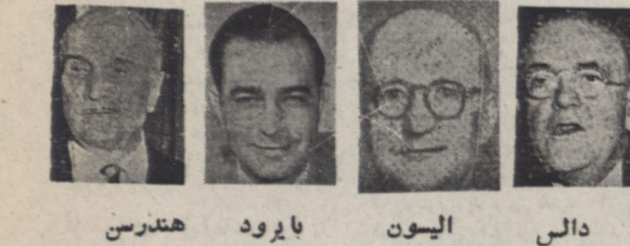
دالس الیون پایرو هندرسن

نیز با سفردار است و داسر وقت با ایراد امر اجتناب از ملاقات کند.