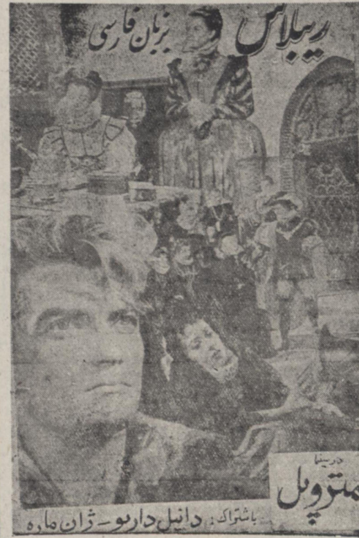
ریپلاس در سینما متر و پیل

مرقم شده است سینما متر و پیل با کمال خوشندی با اطلاع مشتریان گرام خود میسرماند که این فیلم از روز چهارشنبه سو ا تیر ماه بمرض نمایش گذارده میشود