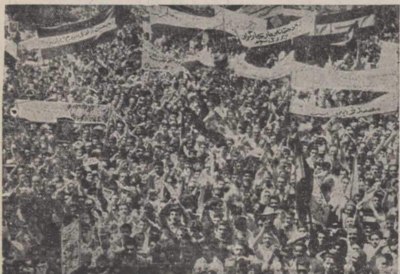
کوشه‌ای از میتینگ دیروز میدان بهارستان که با شرکت دستجات واحزاب و جمعیتها و اتحادیه‌های مختلف تشکیل شد