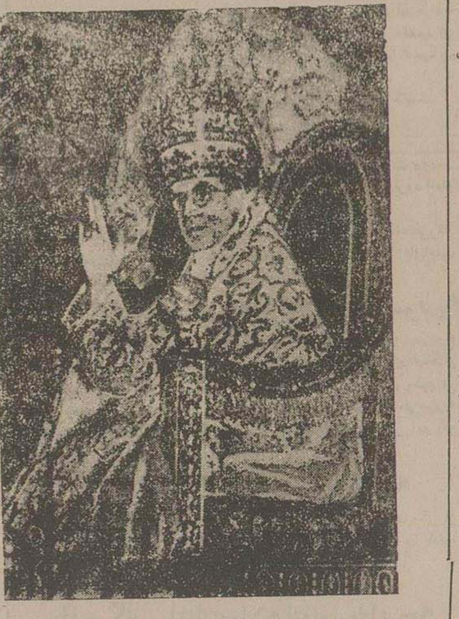
باب بی اعظم دیروز با لباس رسمی و تشریفات مذهبی به عالم مسیحیت حلول سال جدید را هژده داد

باب بی دوازدهم پرودگار بناسبت میلاد مسیح، پایان سال ۱۹۵۰ اعلام و برای سعادت بشر و صلح دنیا در سال ۱۹۵۱ بزرگه پرودگار استفاده کرد و بلافاصله دیشب... پایان سال ۱۹۵۰ اعلام و برای سعادت بشر و صلح دنیا در سال ۱۹۵۱ بزرگه پرودگار استفاده کرد و بلافاصله دیشب