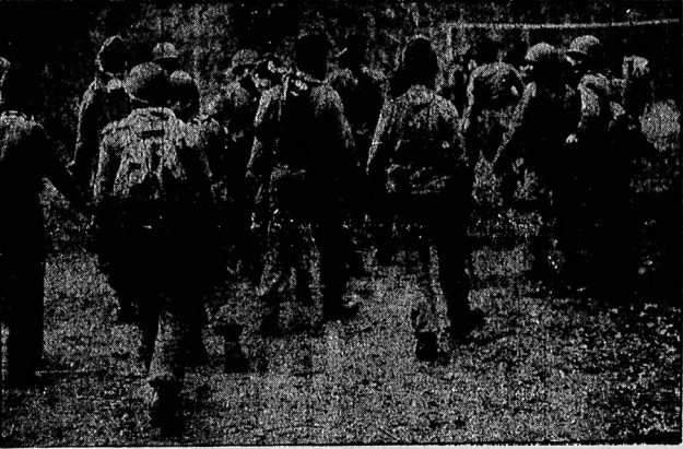
واحد سرساخته ای کاخ پرپر شد در جبهه های گیلانغرب در برابر وحشیگریهای بهشتیها آغاز شده بود با دهها کشته از لشکریان صدام هنوز نامه دارد. یک گروه از روزنامه کارکنان، در حال حرکت به سوی ارتفاعات گیلانغرب در کربلا دیده میشود. در صفحه ۱۰

سخن روز آنروزها خوابی که امیر یالیستها برای انقلاب مادیده بودند جدا داشت که بناسبت هفته وحدت سخنی می گفتیم، همین تقسیم راهم داشتیم، اما حقیقت اینست، که ما با همه وقت تهران در خلیه های حمله گذشته حق مطلب را هر چند به اختصار آنگاریم گمان نمی کنم که ما صرفاً از آن گذشتیم. با اینهمه آنچه بودی، بدست آمد و یادشده ای بسیار بدین شد در این باره قلمی خواهیم زد. در حال حاضر به قضای همان شایسته قلمی نمی جدیدی باشد. روزنامه های دوران انقلاب و همین سالگرد پیروزی ضرورت دارد روزنامه های و حیات خاطرات آنروزها و این اهمیت موضوع مورد بحث، به ما مطلب خواهد بود. به یاد آوریم که در پیش گامی کتیم چه روزها، گروه سازبو تحریف تاریخ یکی از شاهکارهای تاریخ است که در دوران انقلاب و روزهای قبل بود از آن بوده است و هست و خواهد بود. در آنروزها با وجود آن قبیل حضور آیدی رژیم در روزنامه ها و وجود وابستگان گروهها و جبهه ها و سازمانهای مختلف در موسسات مذکور و نیز تألیف و انتشار کتب و نشریات، و وجودی که در جبهه و تحریف لابی و صفحات جرائد نمایان می شد که جز جبهه و تحریف و افق شبهه و بیابان دیگر تمایل اشخاص و سازمانهای گوناگون و بیانش باقی برانقلاب و تاریخ و مردمبارز و انقلابی معترف با آنچه عملی دیگری نداشت.