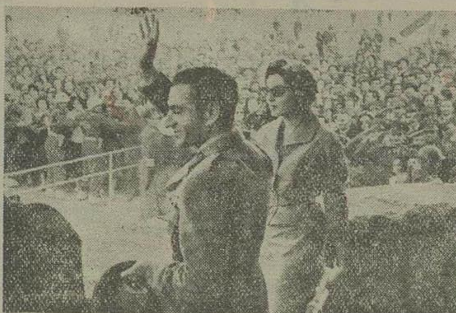
شاهنشاه و ملکه از جایگاه اختصاصی در میدان جلایه بار از احساسات جمعیت کثیر مدعوین و تماشاچیان پاسخ میگویند