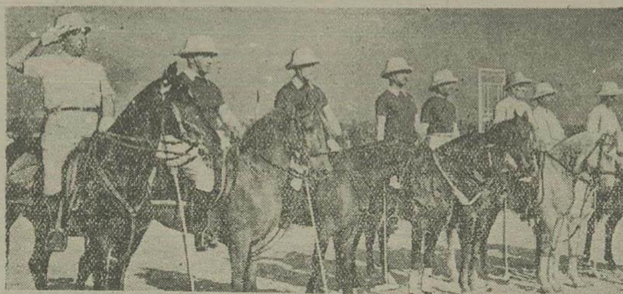
چوگان بازان تیم تهران قبل از شروع مسابقه در یک صف ایستاده و منتظر اعلام شروع مسابقه هستند