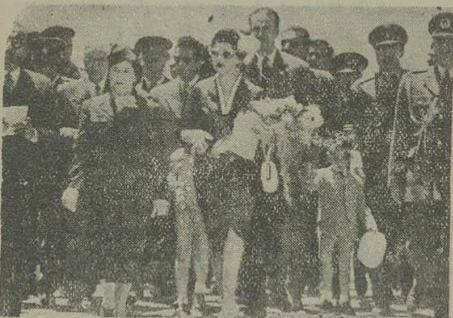
والاحضرت شاهدخت شمس پهلوی هنگامیکه بانقارن آقای بهلیدر عده ای از همراهمان برای افتتاح آسایشگاه مسولین شیراز بعمل میرسد

بطوریکه اطلاع دادیم بعد از ظهر دیروز آسایشگاه مسولین شیر و خورشید سرخ شیراز در حضور والاحضرت شاهدخت شمس پهلوی ریاست عالیبه جمعیت شیر و خورشید افتتاح گردید . از ساعت ۴ بعد از ظهر دیروز مدعوین در محل آسایشگاه حضور بهم رسانیدند و مقارن ساعت ۵ والاحضرت شاهدخت شمس بانقارن آقای بهل به آسایشگاه وارد شدند . در مدخل آسایشگاه یکی از بانوار دست کلبی تقدیم نموده خیر مقدم گفت . هنگامی که والاحضرت بداخل آسایشگاه رفتند از طرف مدعوین نسبت بایشان ابراز احساسات بعمل آمد و سپس آقای دکتر موبد حکمت معاون وزارت بهداری که همراه والاحضرت بشیراز رفته است گزارشی درباره اقدامات بهداشتی و درمانی که در شیراز صورت گرفته و کنکهای که از طرف وزارت بهداری برای ایجاد آسایشگاه گردیده قرائت بقیه در صفحه پنجم