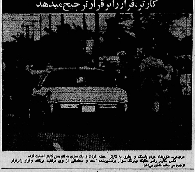
مردمانی، نوردد، مردم باسنگ و بطری به کاتر حمله کردند و یک بطری به اتوبوس کاتر اصابت کرد. مفسن کاتر را پس حالیکه پرتگ سوار بر ماشین شده است و مهاجمین از وی مراقبت می کنند و فرار را برقرار ترجیح می دهند، نشان می دهد.

نورالدین نوری رئیس سابق سازمان شهرستانهای «اطلاعات» دستگیر شد نورالدین نوری رئیس سابق سازمان شهرستانهای «اطلاعات» دستگیر شد نورالدین نوری رئیس سابق سازمان شهرستانهای «اطلاعات» دستگیر شد