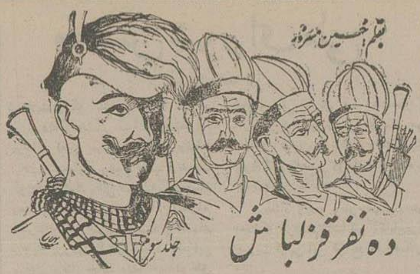
و نفر قربلاش

۱۰- برای اتمام بیمارستان شبر و خورشید سرخ میانه که نزدیک باتام است لوازم فرستاده شود.