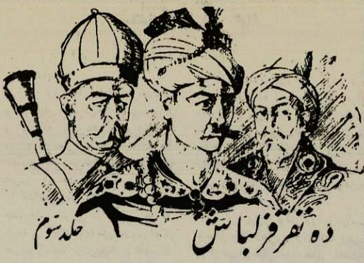
ده نفر قزلباش بقلم: حسین حسرو

پیوارو گفت: شاید شما باین نکته پی نبرده باشی که چگونه هوك در موقع صحبت سر خود را پیش می‌آورد و ابروان خود را رادر هم می‌کشد این عادت دوست عین عادت است که از شما بارت رده ولی در ایسالار چاندانر سالها است که این عادت را دارا می‌بینی بیله حقرت را زوجه اش باو گفته بود علت ترس کارولین از شوهرش و پناهشده شدن او باغوش شما یعنی مریدیکه در نزدیکی واقعا دوست میداشته دلیل برجسته ادعای من است.