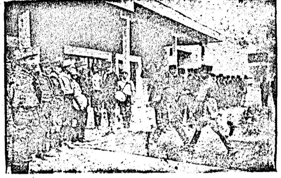
پیش آهنگان ساری در استاسیون راه آهن این گراور والا حضرت ولید را نشان میدهد که از بندر شنه مراجعت مینماید . پیشاهنگان در استاسیون قبلا صف آرایی نموده و بحال احترام ایستاده و والا حضرت از بین صف پیشاهنگی عبور میفرمایند