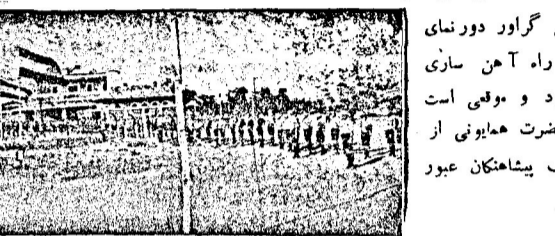
در این گراور دورنامی استاسیون راه آهن ساری دیده میشود و موقعی است که اعلیحضرت همایونی از مقابل صف پیشاهنگان عبور می فرمایند