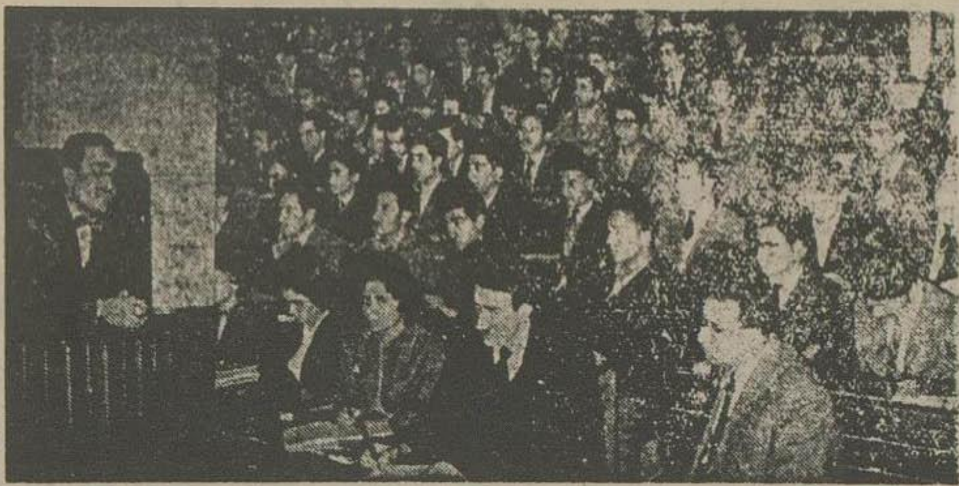
روز پنجشنبه ۸ فروردین دانشکده پزشکی یک کشف جدیدی علمی و پزشکی