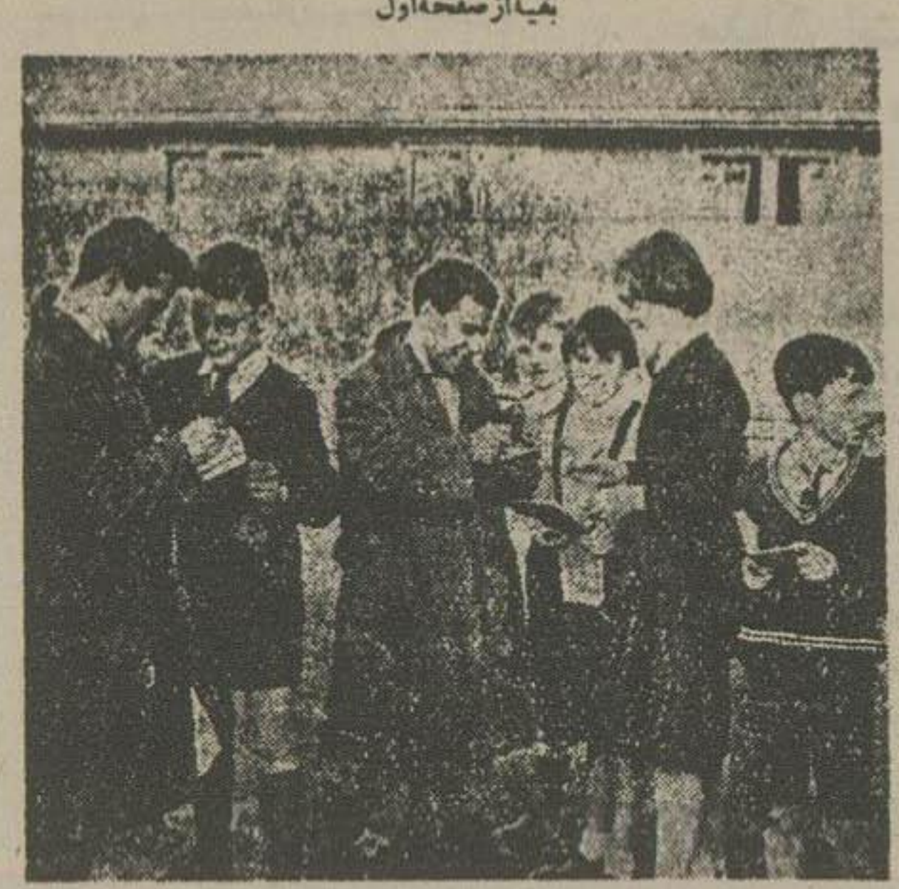
بچه های استرالیایی از نامجو وزرینی قهرمانان هالتر ایران امضاء میکنند