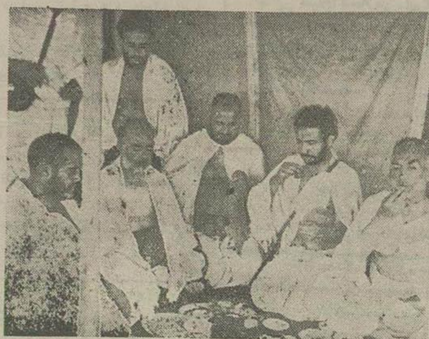
آخرین نهار در مکه

از تاریخ ورود ماوسد هاهزار حاجی دیگر بکنه چند روزی میگذشت ولی اجازه خروج داده نشده بود. بهمان نسبت که گرم و حرارت شدتی یافت جوش و خروش و غلیان و عصیان حجاج از وضع نامطلوبی که داشتند بیشتری شد. رئیس اداره شؤون حج که امور مربوط به نقل و انتقال حجاج را بعهده داشت از بس باحاجی ها بگرمی کرده بود بدوا سر مبتلا گردید. فریاد اعتراض همه بلند بود و مقامات دولت سعودی میفکند دسته های مختلف حجاج هر روزی که وارد شده اند باید يك ماه بعد در همان تاریخ خارج شوند. قیامت ها ساعت ساعت تری میگرد. بقیه در صفحه ششم