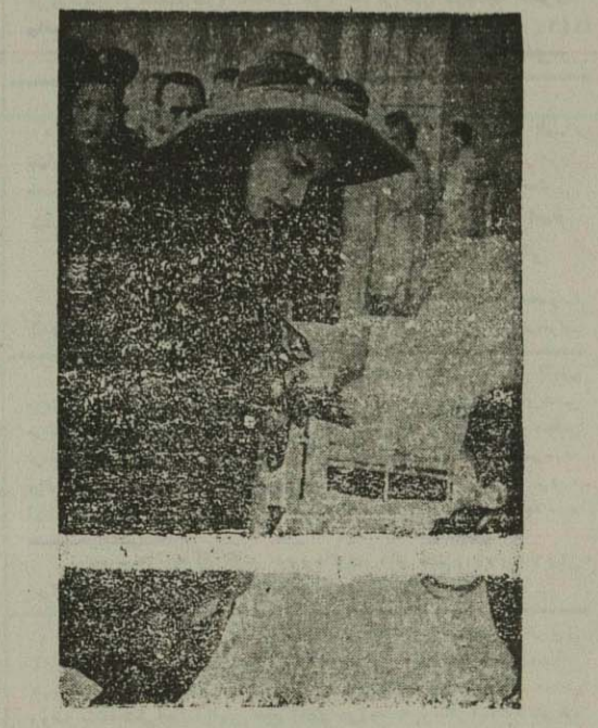
والاحضرت اشرف پهلوی - بطوریکه دیروز اطلاع دادیم، از آسایشگاه شاه آباد دیدن کردند. در این عکس، والاحضرت در برابر تخت سلولی مشاهده میشود.

سرتیپ مقبلی فرمانده تیب گیلان که سرانجام او آستارا را نجات داد بن گفت: صبح جمعه ۲۳ آذر ریاست ستاد ارتش دستور دادند که چون دشمن اردبیل رضایت بخش نیست در صورت امکان نیروی ارتش در وقت در ظرف ۲۴ ساعت از راه خلخال خود را به اردبیل برساند. سرتیپ مقبلی جواب میدهد که چون راه خلخال تمام کوهستانی و برای عبور اراپه های جنگی مناسب نیست در صورتیکه اجازه بدهند ستون بطرف آستارا حرکت کند. با این پیشنهاد موافقت بعمل آمده و شبتا تا یکد میگرد که از بروز هر گونه اشکال و سوء قضاوم سیاسی جلوگیری بعمل آید از این رو روز شنبه ۲۴ آذر ساعت ۱۵ نیروی ارتش از بندر پهلوی بطرف آستارا حرکت کرد. ساعت چهارده و نیم آنروز ستون در ۷ کیلومتری آستارا با عده ای از عناصر مرقب مانچر جوانی مصادف میگردد و در اثر تیر اندازی شدید ستون، مانچر جوان عقب نشینی می نماید. تا ساعت ۱۷ فقط تیر اندازی فتنه از نمایان شیده م شده ولی از این ساعت بیداشتمتند و شدیدی از طرف آنان آغاز میگردد. مانچر جوان با فتنه - مسلسل - طپانچه و نارنجک و بمب بمش می بردارند. به گناه هانی که رها می گیه در صحنه ششم