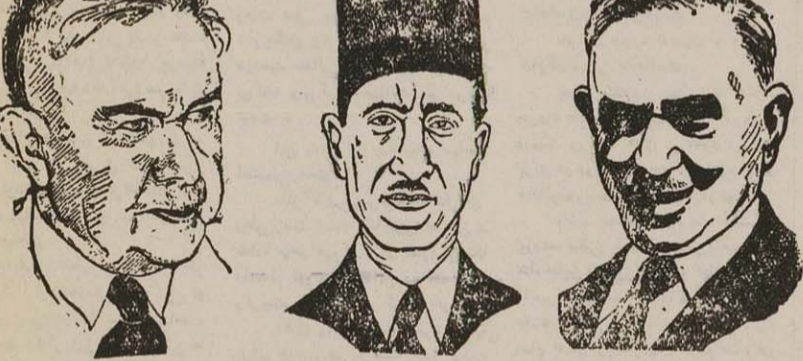
فارس النوری مامور تشکیل کابینه سوریه / توفیق ابوالهدی نخست وزیر اردن / لوری السعید نخست وزیر عراق