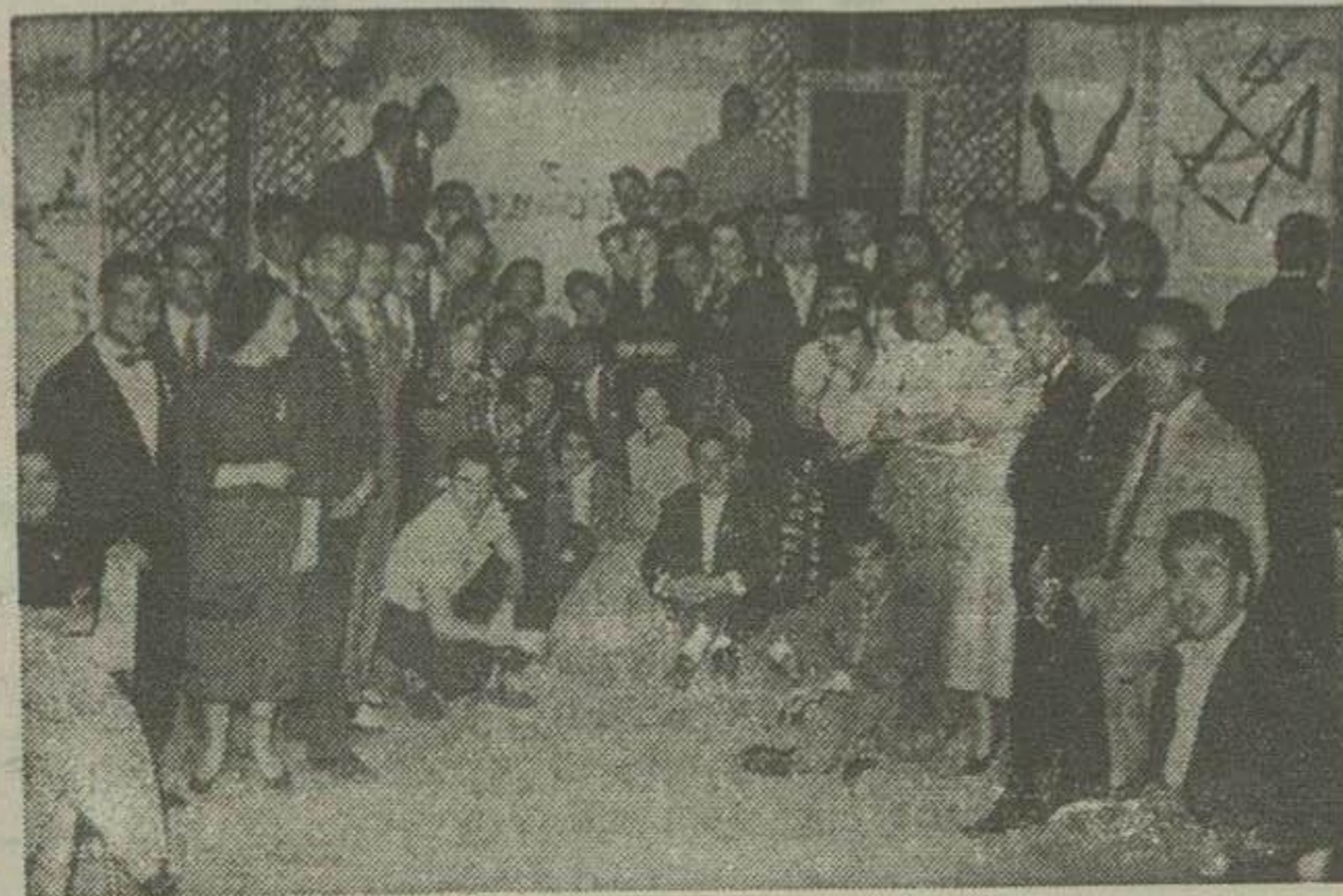
دانشجویان ایرانی دانشگاه بیروت در مراسم جشن نوروز

مراسم چهارشنبه سوری در سواحل دریای مدیترانه انجام شد - در بیروت سنج و سبزی خوردن برای سفره هفت سین پیدا نمیشد - افغانهای مقیم لبنان هم در مراسم نوروز همراه ایرانیان شرکت کردند