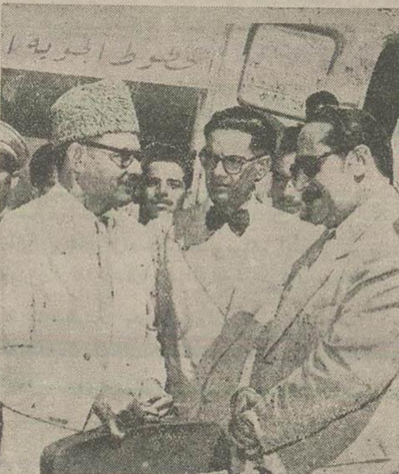
آقای اشتیاق حسین وزیر فرهنگ پاکستان در فرودگاه مهر آباد در حالیکه آقای حاد معاون وزارت فرهنگ بوی خیر مقدم میگوید آقای میان نسیم حسین کاردارسفارت پاکستان نیز در وسط دیده میشود

و دفتر مخصوص شاهنشاه و ملکه را امضاء نمود عصر امروز مجلس ضیافتی بپای بافتخاروی در سفارت کبرای پاکستان منعقد میشود