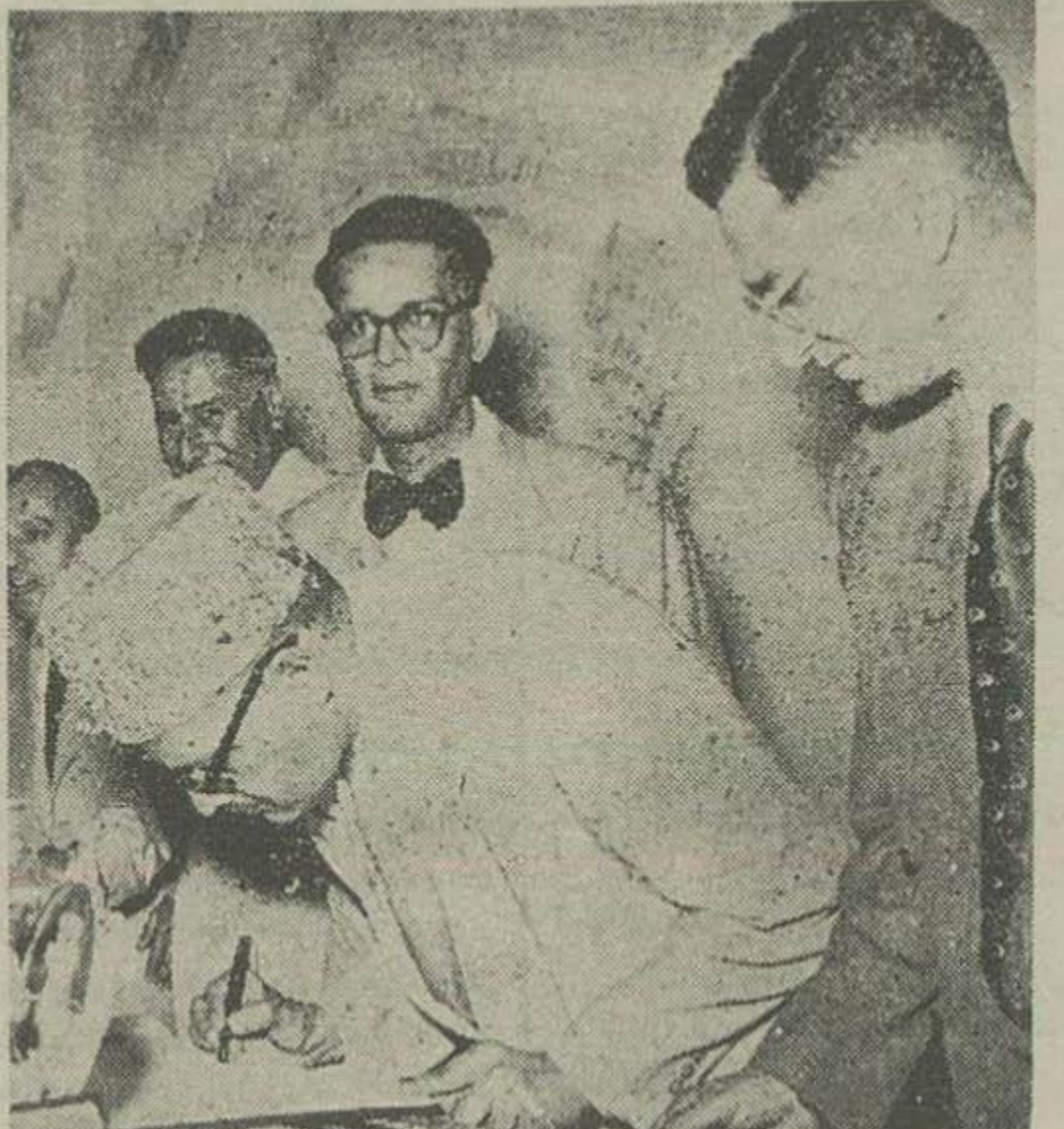
آقای اشتیاق حسین وزیر فرهنگ پاکستان هنگام امضای دفتر مخصوص اعلیحضرت هایونی با آقایان میان نیم حسین کاردار و عرفانی وابسته مطبوعاتی سفارت پاکستان دیده میشوند.

رامعرفی نمود. و علیحضرت ملکه تریا پهلوی یکاخ مرمری رفتند.