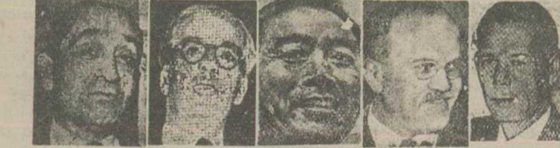
یونان آمریکا - نماینده امریکا سراژتف - نماینده شوروی چونگ لای - نماینده چین ایدن - نماینده انگلیس مهندس فرانس - نماینده فرانسه

رؤسای هیئت نمایندگان کشورهای بزرگ در کنفرانس ژنو