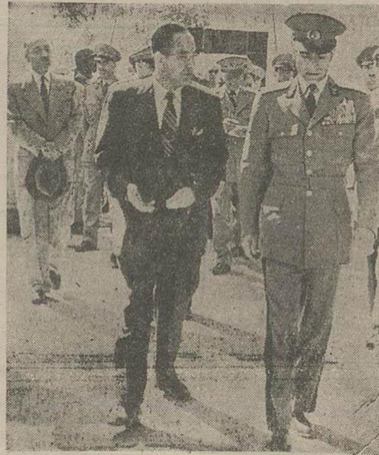
اعلیحضرت همایونی هنگام تشریف فرمائی به بیمارستان شاهپور - آقای دکتر جهانشاه صالح وزیر بهداشتی نیز در التزام میباشد.

تشریف فرمائی بهماگو شاهنشاه دیشب در خوی توقف فرمودند بازدید از کارخانه قدرضاییه و بیمارستان شاهپور اوامرشاهانه در باره رفع نواقص بیمارستان و بهبود وضع کارگران کارخانه قند