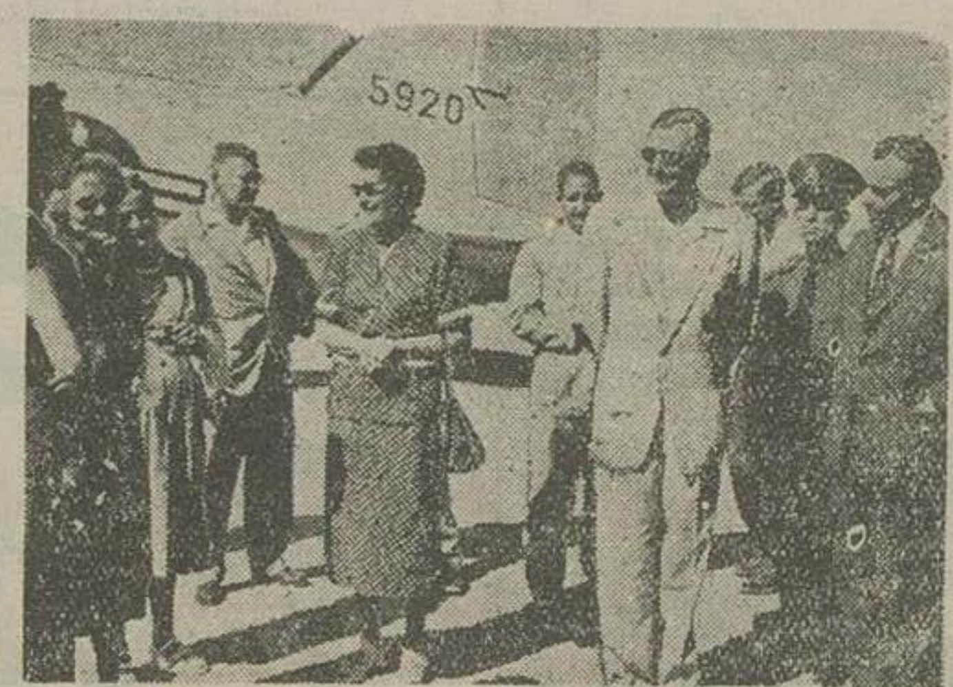
آقای «هور» مشاور نفتی وزارت امور خارجه آمریکا و بانو هنگام ورود به رود کردگاه شیراز دیده میشوند

مشاور نفتی وزارت امور خارجه آمریکا پس از یکروز توقف در شیراز و بازدید از آثار تاریخی آن شهر امروز به تهران مراجعت نمود