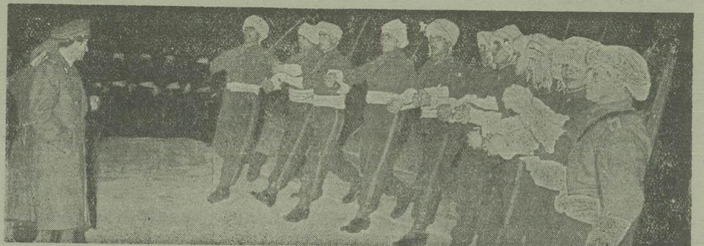
دانشجویان دانشکده افسری در پیشگاه ملو گانه در حین انجام برنامه نمایش آتش بگرد یکدیگر حلقه زده اند

در ساعت هشت و نیم صبح امروز کمیسیون بریاست آقای دکتر اردلان وزیر امور خارجه و با حضور تیمسار سعید جهانبانی رئیس هیئت علامت گذاری مرزی ایران و شوروی - تیمسار سرینب کیا رئیس اداره اطلاعات ستاد کل - تیمسار سرینب سیاسی رئیس کل مرزبانان - تیمسار سرینب سیاسی - دکتر جزایری رئیس اداره امور مرزی - سرهنگ فیروز بخش آجودان تیمسار جهانبانی - سرهنگ چرخشت نماینده اداره کل مرزبانان - ناخدا یکم تقی بهنام افسر نقشه بردار کمیسیون مرزی تشکیل گردید. در این کمیسیون که در تعقیب دو جلسه قبلی تشکیل شده بود و تا ساعت یازده و نیم ادامه داشت درباره اختلافی که اخیرا قیه در صحنه چهارم