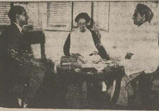
استدعا دارم نقشه عملی کار خود را مربوط به ملت و پیش بینی هایتیکه برای هر یک از این جهات بوده اند بر بخش مجلس شورای ملی و ملت ایران برسانند تا علاوه بر اینکه اذهان عمومی نسبت به مسائل نفت کمی روشن شود از پشتیبانی کامل ملت و نمایندگان معظم در حل قضیه تا پایان رسانیدن کار برخوردار باشند.