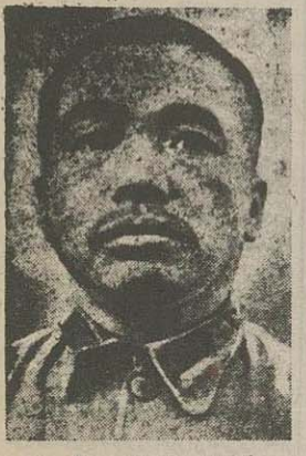
ژنرال ریجوی نایبند ارتش داوطلب چین