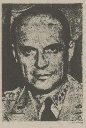
ژنرال ریجوی نایبند ارتش آمریکا