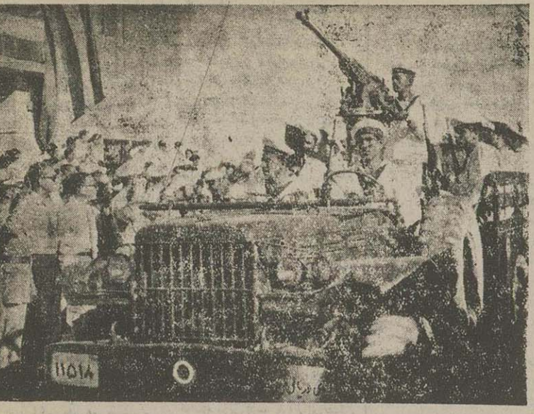
روزه بادگان آبادان که روزجمعه سورت گرفت بازوه افراد نیروی دریائی جنوب آغاز شد. درین عکس یکی از اوزومبیلهای حامل افراد نیروی دریائی مسلح سلاح های سنگین و سنگین هتکام عبور از برابر اعضای هیئت و فرماندار نظامی آبادان و فرمانده نیروی دریائی جنوب دیده میشود.

مدتی برای این پیشنهاد معلوم شود که هم آبروی اشخاص مصون بماند و هم کسانی که بیسلسلت خیاات کرده اند شدم با مجازات شوند. آقای سفلی گفت که آن دستفامی که این کارها را برای مرعوب کردن و کلا کرده بودند مقصودشان لجن مال کردن مغالین دولت بوده است و بشاویین مختلف افراد را هم از روزنامه نویسی و چاپ بیهوده. مجلس شورای ملی بآقای سفلی پیشنهاد کرده است.