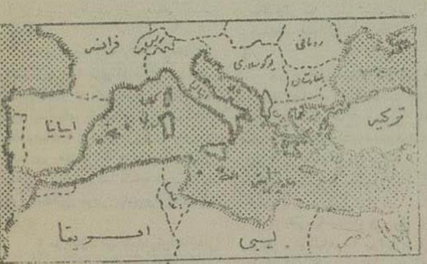
کشورهای حوزه دریای مدیترانه