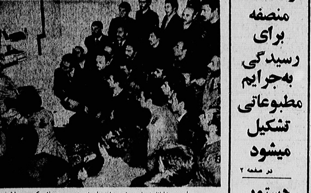
صبح امروز خلبانان و خدمه ۸ هواپیمای نیروی هوایی که در هلیات بیابان ۴ پایگاه نظامی در استان خراسان شرکت داشتند، به حضور امام خمینی، رهبر انقلاب و بنیانگذار جمهوری اسلامی ایران رسیدند. ضمن این دلاوران را در حضور امام است نشان میدهد شرح صفحه ۲