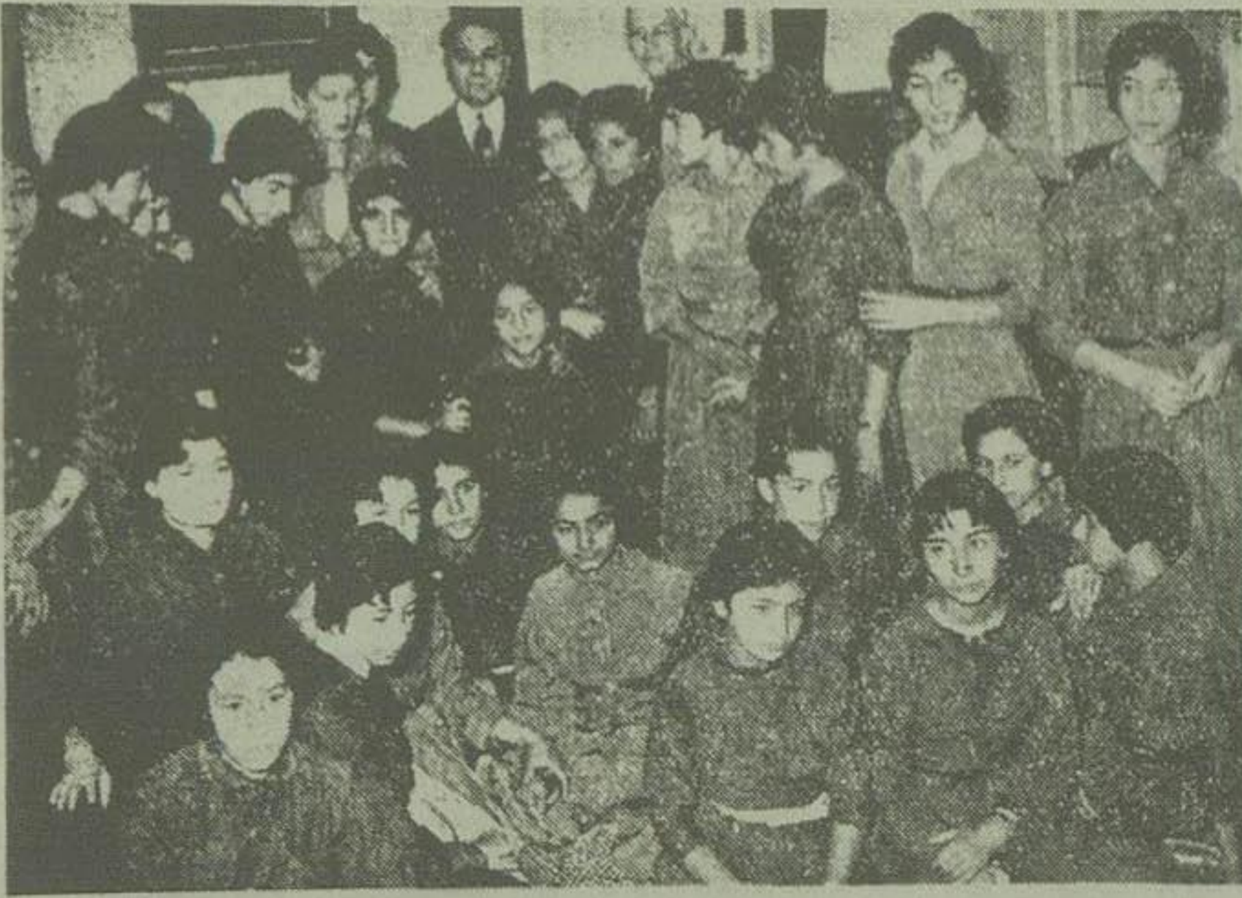
دربان عکس آقای مهندس اشرافی وزیر پست و تلگراف و تلفن در میان دخترانی که آلمان اعزام میگردند دیده میشود