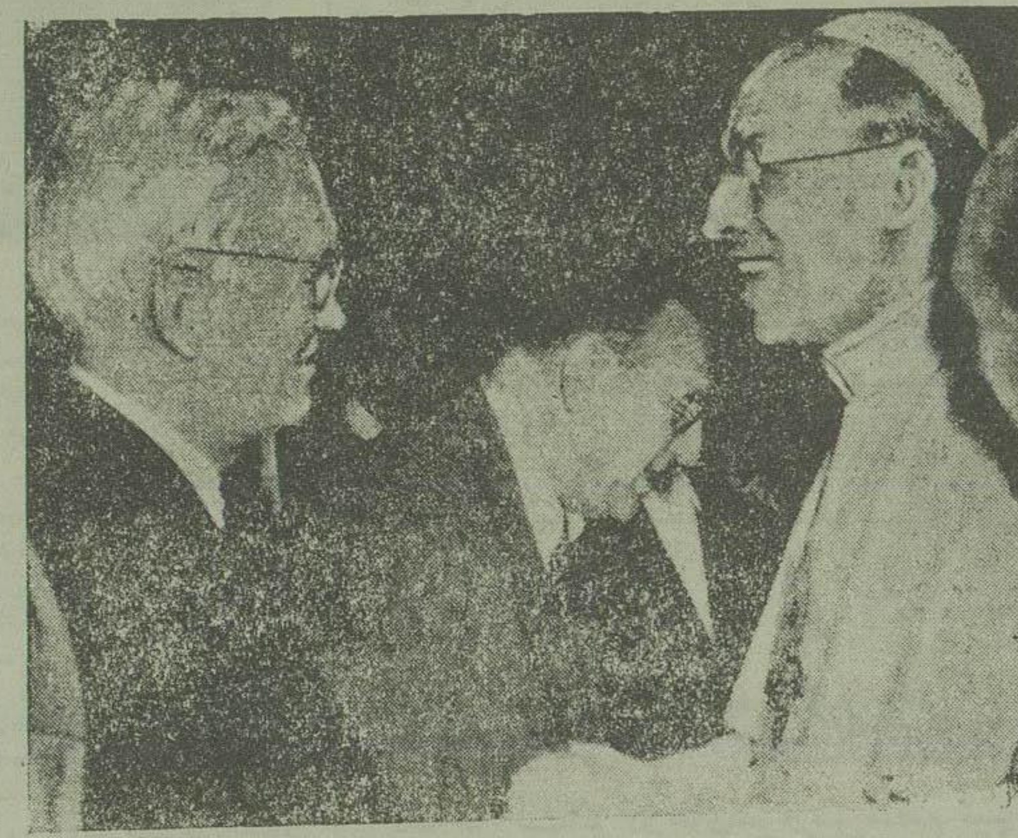
وم - اسوشیتد پرس - سرالکساندر فلمینگ کاشف «پنسیلین» که برای شرکت در کنگره علمی وارد وم شده است چند روز قبل باشریفات مخصوص در کاخ کاننلف بضمور پاپ اعظم بی دوازم پذیرفته شد . پایپی بنام خدمت بزرگی که وی در قرن بیستم با اختراع داروی اعجاز آمیز پنسیلین بجات نوع بشر نموده است از وی تقدیر نمود .

لندن ( یونایتد پرس ) - بقرار اطلاعی از محافل رسمی ومطلع کسب شده است مذاکرات وزیر امور خارجه مصر با سفیر کبیر انگلستان در آنکشور نه تنها پایان نیافته بلکه نتایج قابل ملاحظه ای هم از این مذاکرات که بطور کلی راجع بروابط فریبین دولتی میباشد حاصل نشده است .