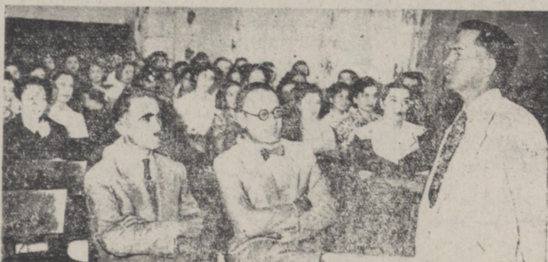
آقایان دکتر آذری و وزیر فرهنگ و دکتر معاصر معاون نری وزارت فرهنگ و عده ای از مدعوین هنگام استماع نطق دوران رئیس اداره همکاری فنی ایران و امریکا دیده میشوند

دفتردار سفارت آلمان نیز باتفاق آقای هاژ وارد گردید و در این سفارت از فردا شروع تهیه مقدمات افتتاح سفارت آلمان در ایران خواهد کرد و بطوری که اطلاع دادیم آقای دکتر کبیر هارم وزیر مختار آلمان پس از افتتاح سفارت آلمان بایران وارد شده مشغول کار خواهند شد.