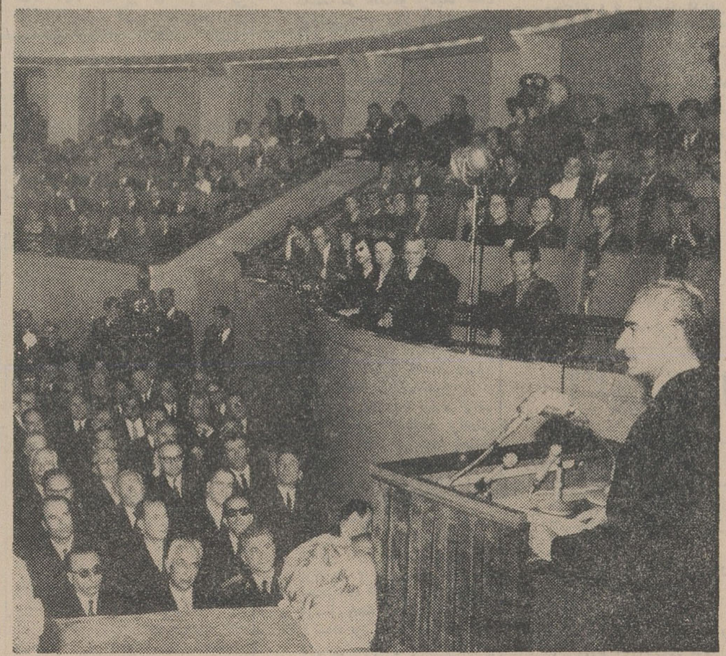
بودند قرار گرفت و باکف زندهای متمدن استقبال گردید .

لوموند به این پرسش پاسخ میدهد زرنال «وان این دونک» رئیس ستاد ارتش ویت نام شمالی اخیرا با توجه باقدمات اخیر امریکا در ویت نام جنوبی اوضاع این کشور را بدت مورد بررسی قرار داده و نسبت بانها اظهار خوش بینی کرده است . وی معتقد است که امریکا با استراتژی که اکنون در ویت نامدر پیش گرفته کاری از پیش نخواهد برد و اینکه میگویند در این جنگ غالب از این عده بیست هزار نفر در سیام و شصت هزار نفر در کشتی های جنگی وابسته بناوگان هفتم امریکا مستقر هستند .