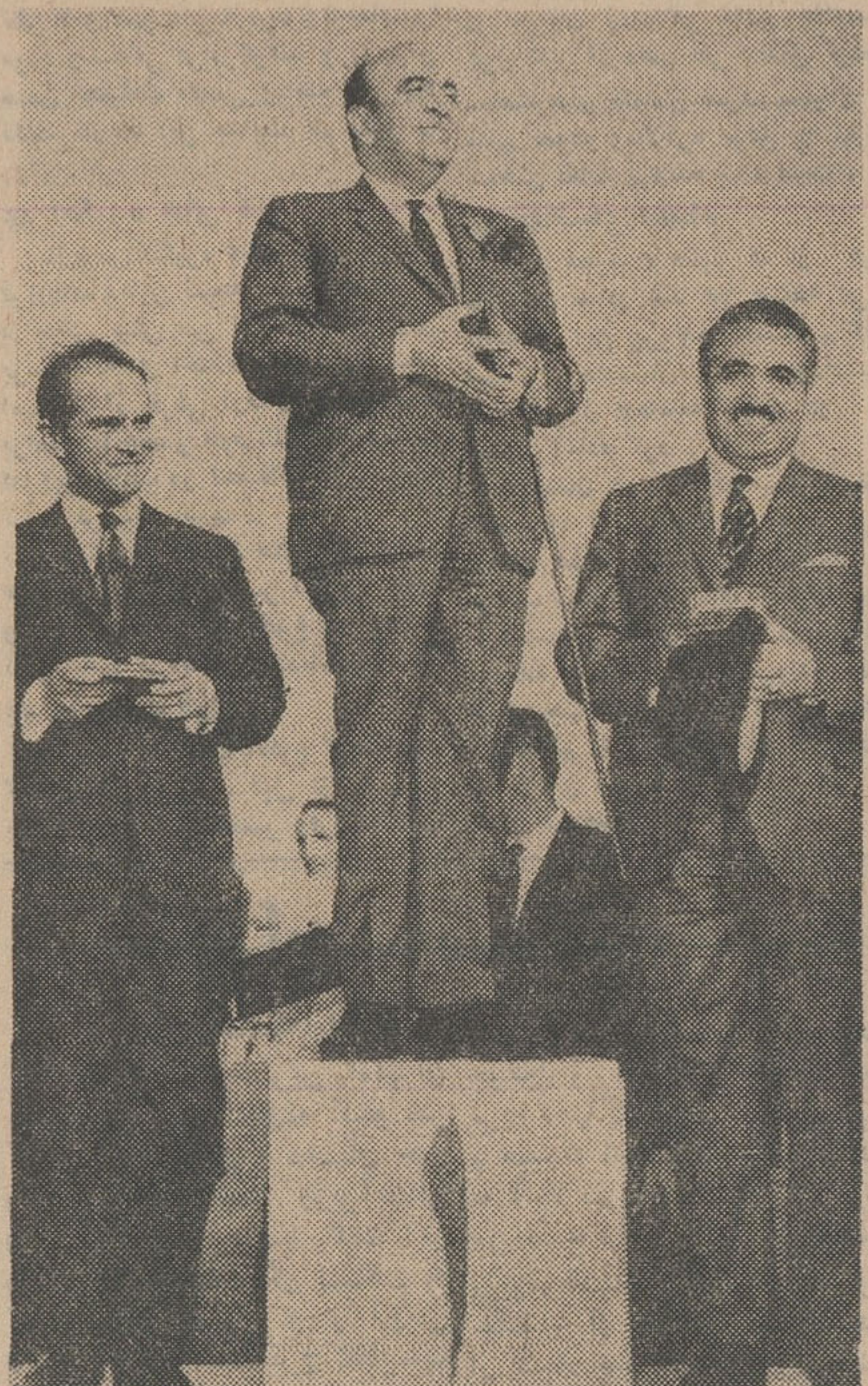
آقایان هويدا نخست وزیر ، دکتر هدایتی وزیر آموزش و پرورش ، پیریا استاندار فارسی روی سکوی قهرمانان ایستادند و مدال گرفتند .

* دختران ورزشکار بگردن نخست وزیر گل آویختند و نخست وزیر قول داد كه بودجه ورزش را افزایش دهد نخست وزیر در كنكره تربیت بدنی گفت: نواقص كار های خودتان را به كردن جوانان نیندازید . آقای هويدا نخست وزیر، دیروز