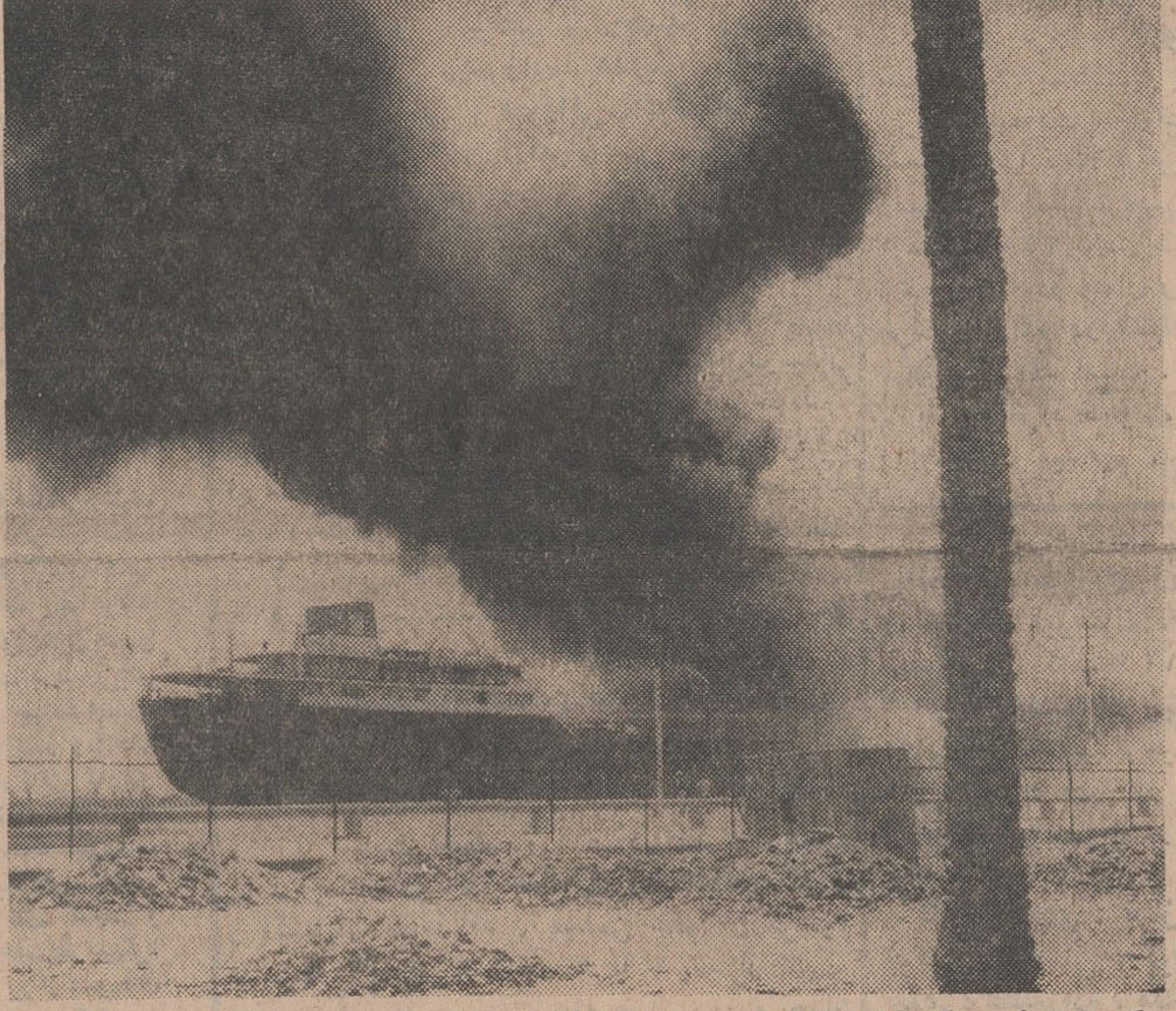
کشتی لیبیائی در اسکله آبادان در حال سوختن است . این کشتی نیم ساعت پس از خاموش شدن حریق دوباره آتش گرفت

* آتش از آبهای اسکله به ارتفاع ۱۰ متر زبانه می کشید و یکی از کشتی ها تا غروب دیروز میسوخست * یکی از کارکنان نفتکش فرمانده و ۶ تن دیگر از کارمندان کشتی آسیب دیده‌اند بقیه در صفحه سیزدهم