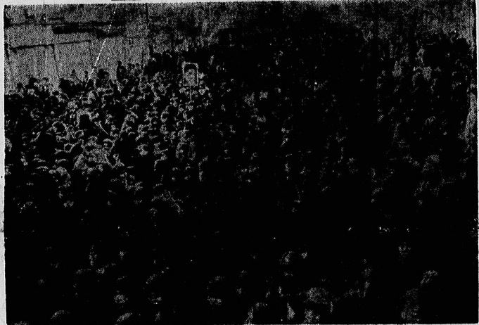
میلیونها نفر از انقلابی بیروز دست پر ابراهیمی زده و خواستار تغییر بنیادی نظام اداری، طاقوت زدانی و انحلال گروه های ضد انقلاب شدند.