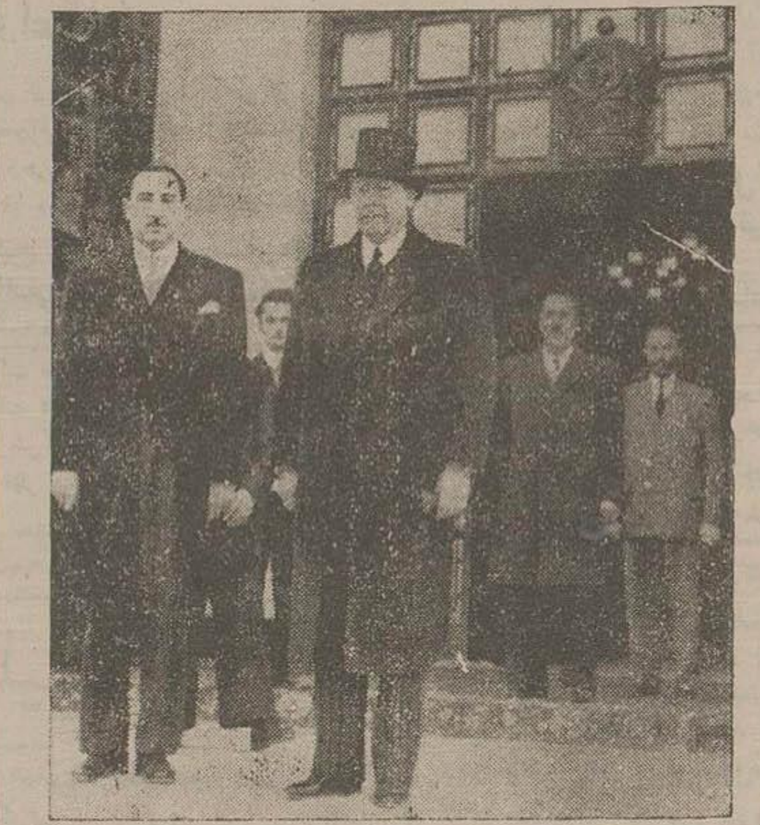
دربوز آقایان اتریکوچرونی سفیر کبیر ایتالیا و سوکوکوزویر مختار هلند با اتفاق بعضی از کارمندان سفارتخانه خود با آرمگاه شاهنشاه فقید در دست گل نثار کردند.