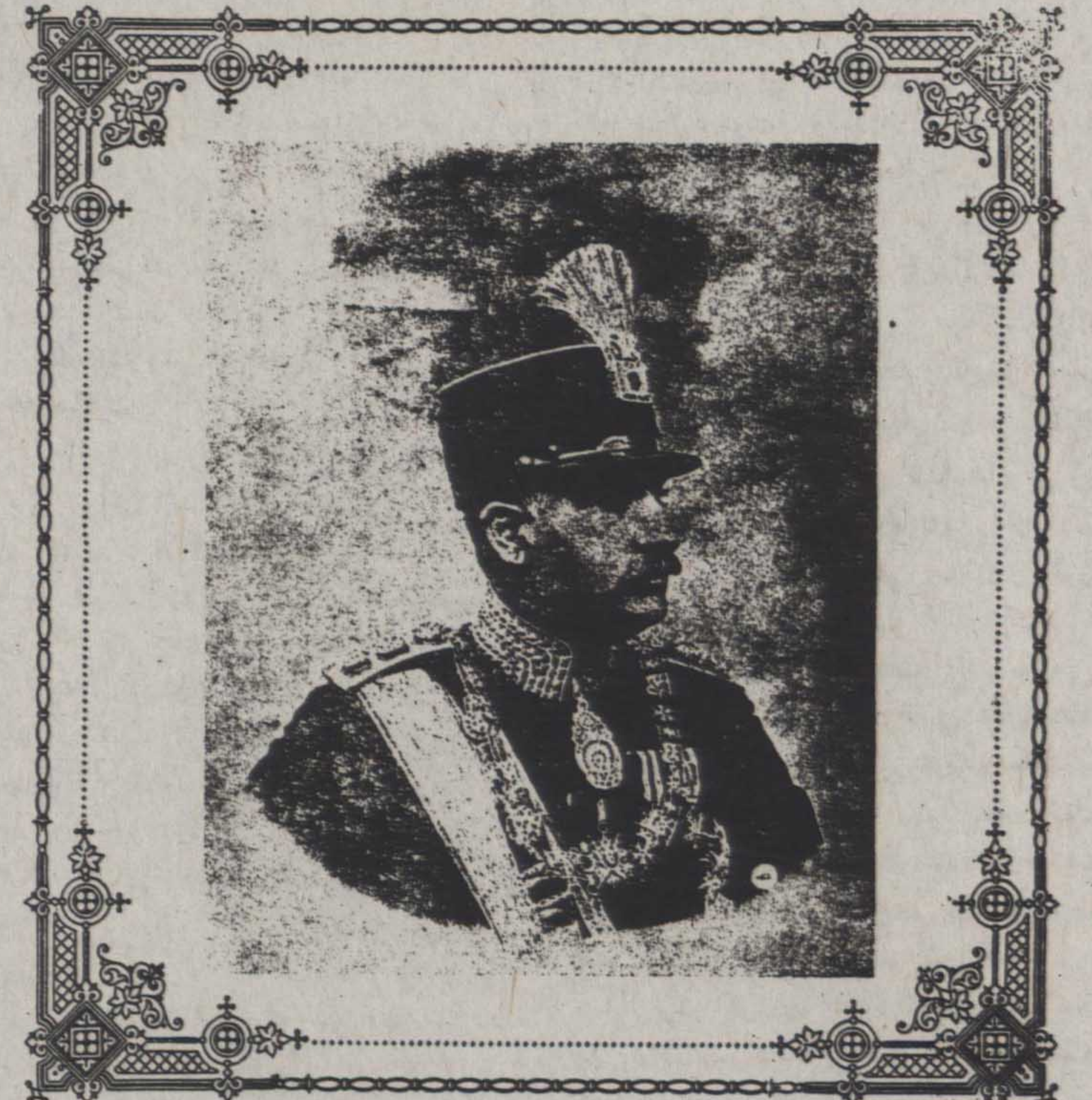
با تقاضای عید بزرگ «۲۰ اردیبهشت» و موفقیت مهمی که در تحت توجیحات یگانه قائم توانا و عنصر وطن پرست ایران نصیب مملکت شده است تمثال مبارک همایونی را زینت بخش روزنامه خود قرار دادیم

درفش پهلوی جیب جمع مواد سرمایه خود را که بخواب نمی دید عملی نموده، بالاخره لفظ یمنی «استقلال» روز بیستم اردیبهشت با جیب معانی و مفاهیم خود بایک آرامش عمیق نظیر به دنیا اعلام می دارد... اغلب با رجال «خوب» و با اطلاع و وطن پرستی نشین و در اطراف آمل، و آرزو های خود سعادت می سکند هم از فوائد و ثمرات کرکی، از مسایب و مضار کاپیتولاسیون، از مشرقات نفس قوانین و قوه قضائیه، مثل بلبل سخن سرانی مینویسند و بالاخره میکنند تا این لکه های ننگ از روی مملکت برداشته نشود محال است اجاب بگذارند ما ها يك قسم بطرف اصلاح و ترقی پیش برویم - همینکه یکتر از ما (چهار مپه ها) جرات می کرد و میگفت: آقایان شما که با این خوبی حرف می زید چرا بالاخره بگفتیم برای اجرا اظهارات خود برنی دارید؟ بطوری هر خوب (دکوراره) بودند و طوری مایوس شده بودند که دیگر جرات حرف زدن نداشتند - فقط با نازک کردن پشت چشم و خارا نندن پشت سکردن و حرکت دادن سر و کله و تبسم های فیلسوفانه بطرف میمانند که تو عقلت نمیرسد - وصول باین آرزوها از محالات است! یعنی ایران مرده است! این روحیات رجال و زمامداران هفت سال قبل ایران بودید معلوم است، جامعه که تحت سرپرستی این قبیل قائمین نشو و نما میکرد و مشروطه را هم از دیک پلو سفارت گرفته بود، وکیل و وزیر، روزنامه نگار، تاجر، کاسب، سیاست باف، حزب ساز و بالاخره همه چیز آن با سفارتخانه ها و دانش از سفارتخانه بوده و با چشم خود دیدیم که حتی تجار ساده لوح ما بیرق اجنبی بر فراز تجارتخانه خود زویدند! ضعف، جبن و اجنبی پرستی جایگزین رشادت، صراحت و غرور ملی شده بود! همانطوریکه قسمهای وسیع ما بطرف شمال و استقلال حقیقی دنیا را با يك جرئت متوجه ایران