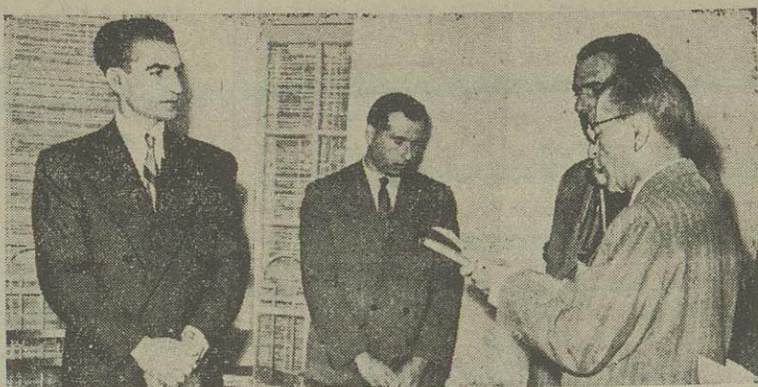
آقای علاء وزیر دربار شاهنشاهی هنگام عرش گوارش بحضور شاهنشاهی