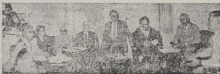
آقایان اعضای فراکسیون نهضت ملی در جلسه امروز

دکتر معظمی امروز اظهار داشت که من بعد بمعطوفه مجلس با نخواهد گذاشت و تمام کارهای پارلمان تحت نظر هیئت سرپرستی اداره خواهد شد