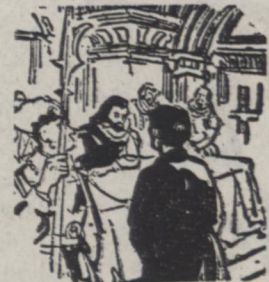
جلوی کیلیسی معروف و الواسیای تشکیل میگردد و بنظم مردم رسیدگی میکند

قدیترین دادگاه جهان در اسپانیا است از سال ۱۹۶۱ یعنی نزدیک به هزار سال است که دادگاه مزبور هر روز پنجشنبه در