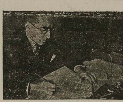
آقای سر لشکر فیروز وزیر راه

بنظر ما و بنظر هر شخص منصفی که خوب با اوضاع این کشور واقف باشد از این بیس مصلحت مملکت ایجاب می کند که آقایان نمایندگان بجای حرف قدری بمل بر دزدان، بجای شرم در دها و آلام و تنگناهای مشکلات و گرفتاریها که عموماً از آن آگاهند و بقدر کافی راجع به هر یک از آنها حرف زیاد زده شده وقت خود را در کسب و کارهای غیر ضروری صرف نموده و مواردیکه ضرورت میداند پیشنهادت و طرحهایی برای اصلاح امور تهیه نمایند و پیشنهاد کنند.