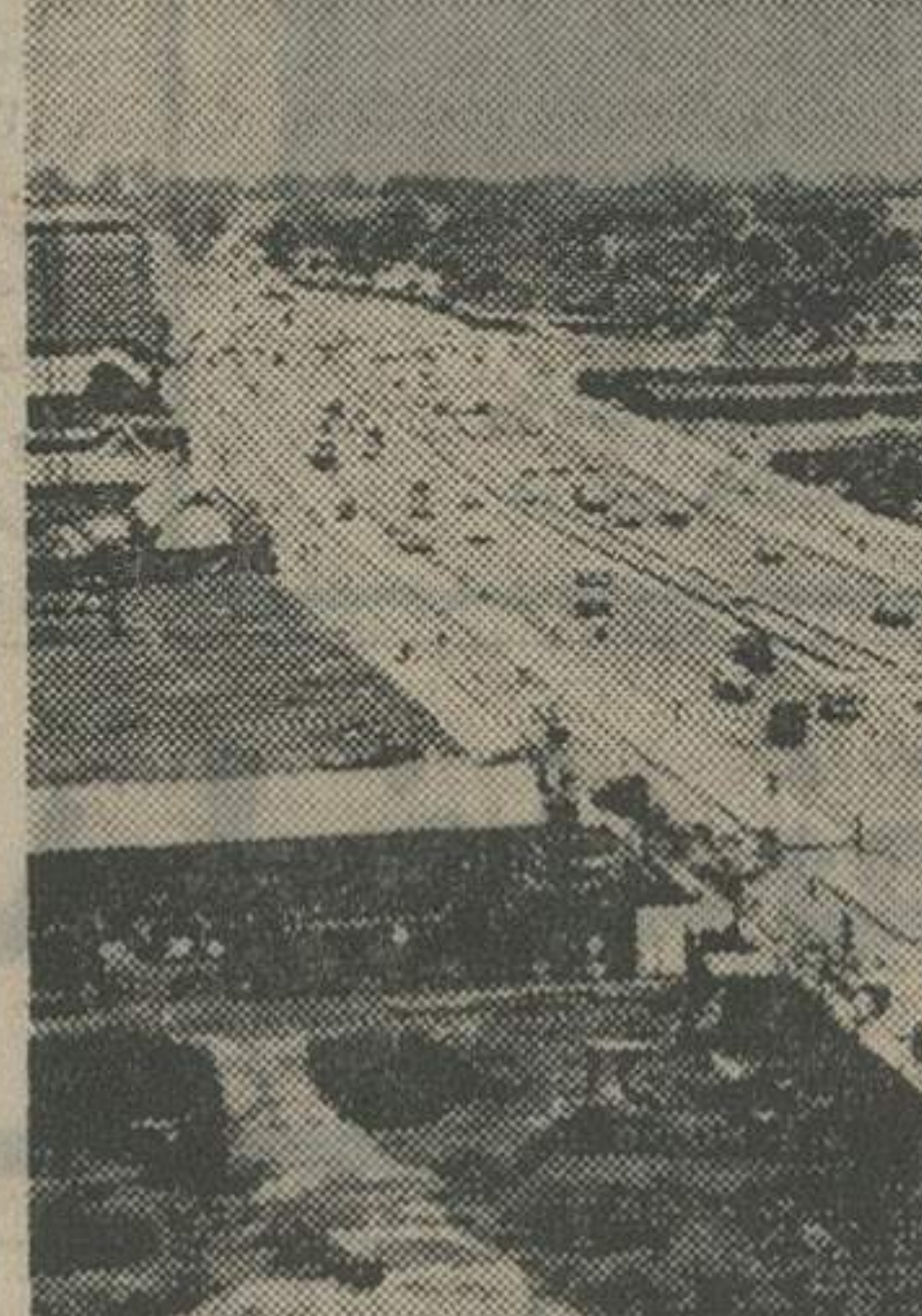
شهر زیبا و پرجمعیت جاکارتا ، پایتخت اندونزی ، امروز باشکوه فراوان از شاهنشاه و شهبانو استقبال کرد .

برف است ، در اندونزی بهار و تابستان و بانیز و زمستان وجود ندارد و بطور کلی فصول آندوفصل مرطوب و خشک تقسیم میگردد .